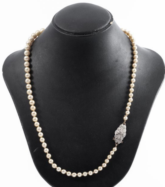
531 COLLANA di perle coltivate a degradare con susta in oro giallo e bianco 12 KT e diamante vecchio taglio (g. 10,95). Stima € 250 - 300 Base d'asta € 130