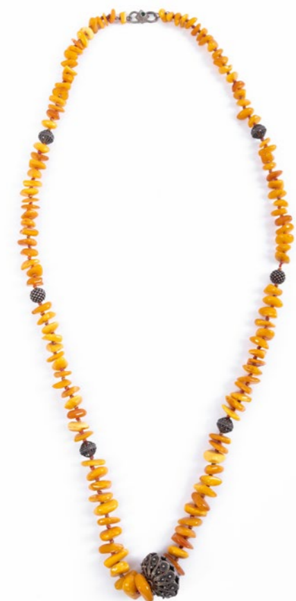
503 COLLANA in ambra con divisori in argento lavorato e susta in metallo (g. 157,00) (usure). Stima € 150 - 200 Base d'asta € 50