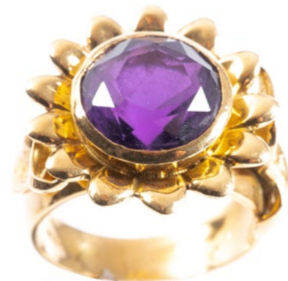
575 ANELLO in oro giallo lavorato 18 KT con ametista (g. 10,60). Stima € 500 - 550 Base d'asta € 300