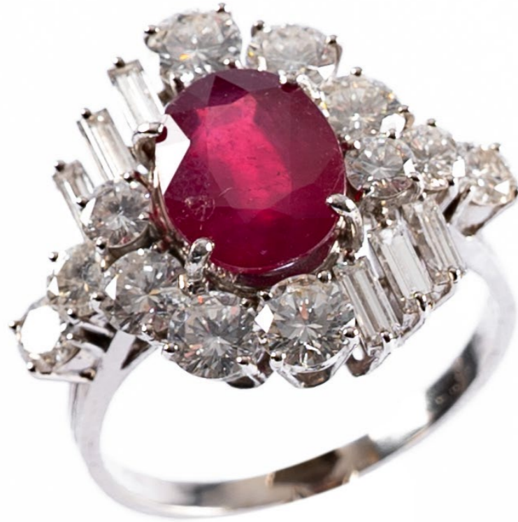
593 ANELLO in oro bianco 18 KT con diamanti taglio brillante ct. 2,30 peso di stima | COLOR VVS2, diamanti taglio baguette ct. 0,12 | COLOR VS2 e rubino centrale trattato ct. 3,21 (g. 6,10) Stima € 8000 - 10000 Base d'asta € 3000