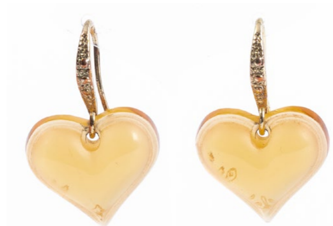
501 ORECCHINI in cristallo Laliq a forma di cuore color ambra con chiusura in metallo dorato (usure). Stima € 120 - 150 Base d'asta € 50