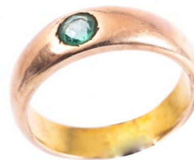
584 ANELLO in oro giallo 18 KT con smeraldo ct. 0,20 peso di stima (g. 5,00). Stima € 380 - 420 Base d'asta € 200