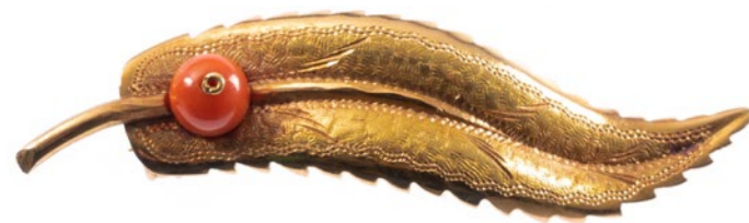
549 SPILLA a guisa di foglia in oro giallo 18 KT e perlina in corallo (g. 4,00). Stima € 300 - 320 Base d'asta € 170