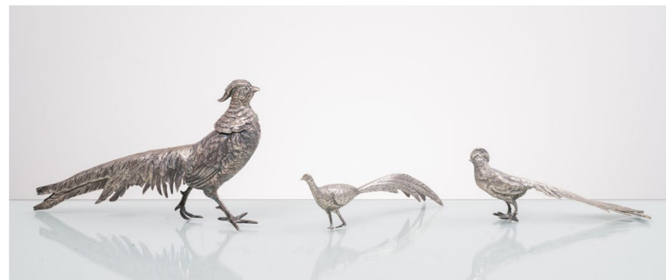
619 TRE SCULTURE in argento raffiguranti "Faggiani" di cui uno con vano contenitore punzone argentiere AF (g. 657) (usure e mancanze). cm 27 x 5 Alt. 15 - cm 21 x 3 Alt. 6 - cm 21 x 5 Alt. 6 Stima € 650 - 700 Base d'asta € 350