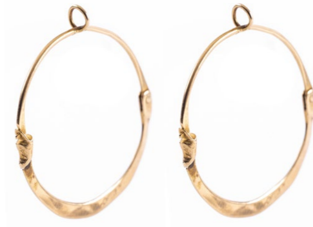
566 ORECCHINI a cerchio in oro giallo 9 KT (g. 6,40). Sicilia XIX secolo Stima € 350 - 400 Base d'asta € 260