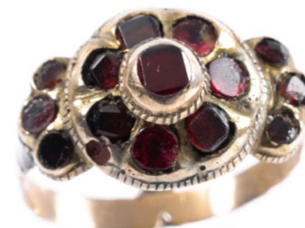
506 ANELLO in oro 9 KT con granati (g. 3,90) (usure e saldature). Piana degli Albanesi XVIII secolo Stima € 200 - 250 Base d'asta € 70