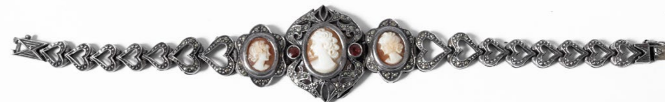
505 BRACCIALE in argento lavorato con sardonici raffiguranti "Mezzi busti femminili" e rubini ct. 0,06 (g. 9,35). Stima € 180 - 200 Base d'asta € 70