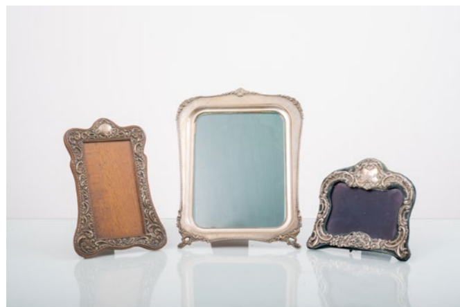
632 CINQUE PORTAFOTO in argento. Italia XIX e XX secolo cm 27 x 15 - cm 27 x 21 - cm 19 x 16 - cm 25 x 17 - cm 31 x 24 Stima € 120 - 150 Base d'asta € 50