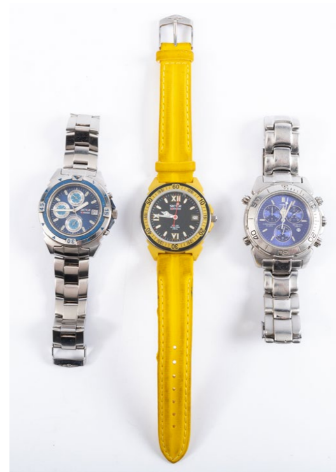
645 TRE OROLOGI Orologio Sector Expander 202 in acciaio con cronografo, orologio Sector Expander 100 e orologio Sector Advanced 4500 in acciaio con cronografo (usure). Stima € 250 - 300 Base d'asta € 120