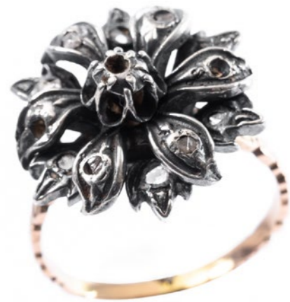
543 ANELLO in oro giallo 9 KT e argento con diamanti ct. 0,10 (g. 7,85) (tre diamanti mancanti). Anni '40 Stima € 350 - 400 Base d'asta € 150