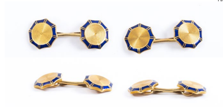
510 COPPIA DI FERMAPOLSI in oro giallo 18 KT e smalti blu (g. 8,15). Stima € 380 - 420 Base d'asta € 100