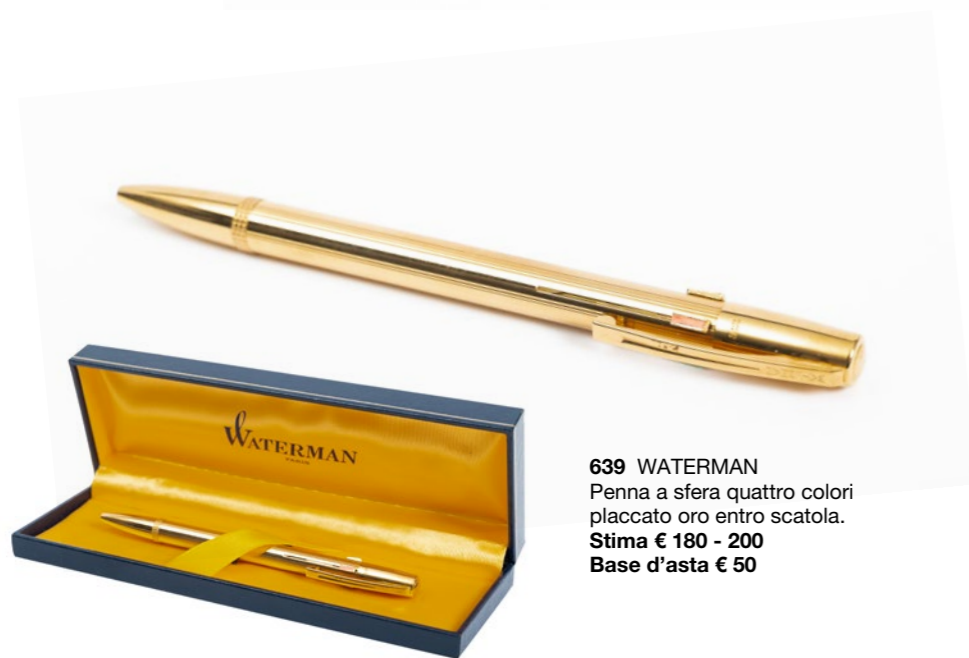
639 WATERMAN Penna a sfera quattro colori placcato oro entro scatola. Stima € 180 - 200 Base d'asta € 50