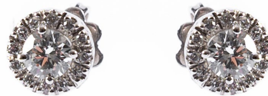
592 ORECCHINI in oro bianco 18 KT con diamanti centrali taglio brillante ct. 0,45 peso di stima H COLOR VS1 e diamanti laterali taglio brillante ct. 0,20 I COLOR VS1 (g. 3,10). Stima € 1400 - 1500 Base d'asta € 750