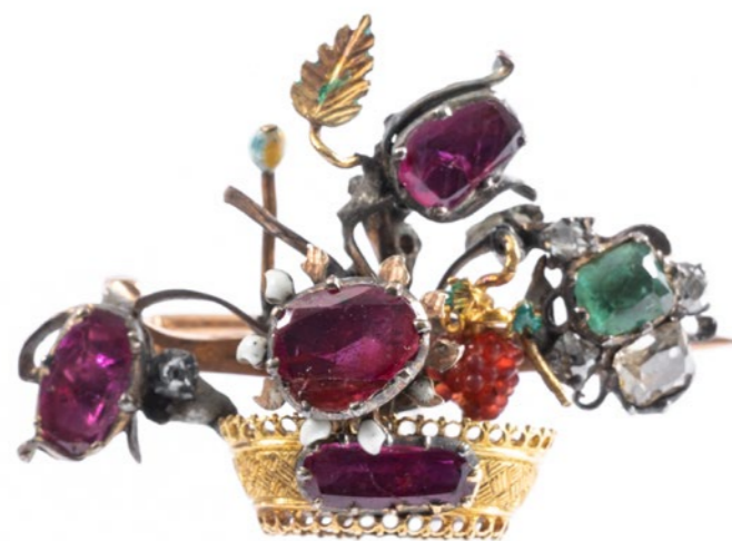
533 SPILLA in oro giallo 9 KT e argento con diamanti vecchio taglio ct. 0,16, smeraldo naturale ct. 0,15, rubini ct. 0,50 e smalti (g. 8,15) (usure) Stima € 350 - 400 Base d'asta € 150