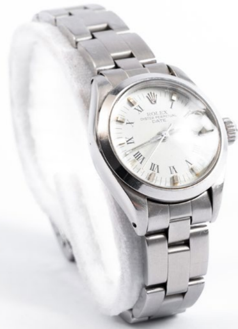
595 OROLOGIO ROLEX in acciaio, automatico (usure e da revisionare). Anni '70 Stima € 900 - 1000 Base d'asta € 400