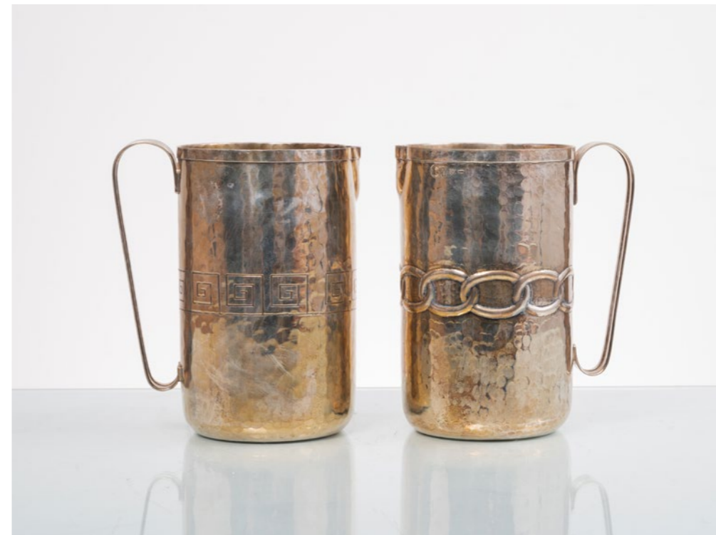
618 COPPIA DI CARAFFE in argento, interno in argento vermeil. Argentiere F.lli Calegari - Teolo Praia (g. 875) Anni '70 cm Alt. 17 Stima € 850 - 900 Base d'asta € 450