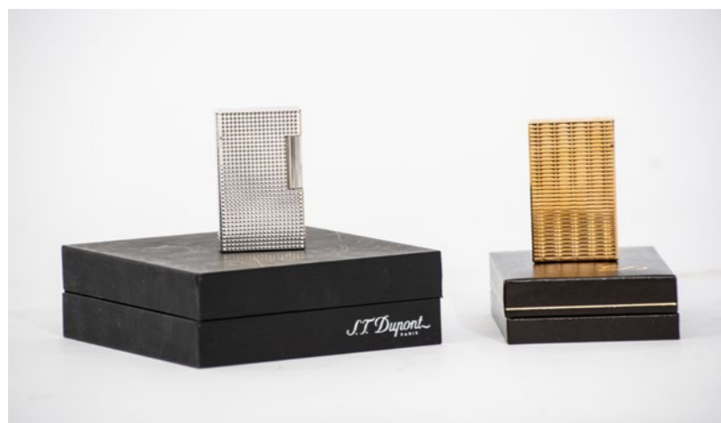
633 S.T. DUPONT Accendino in acciaio argentato ed accendino placcato oro, entro custodie originali (graffi). Alt. cm 5,5 Stima € 450 - 500 Base d'asta € 50