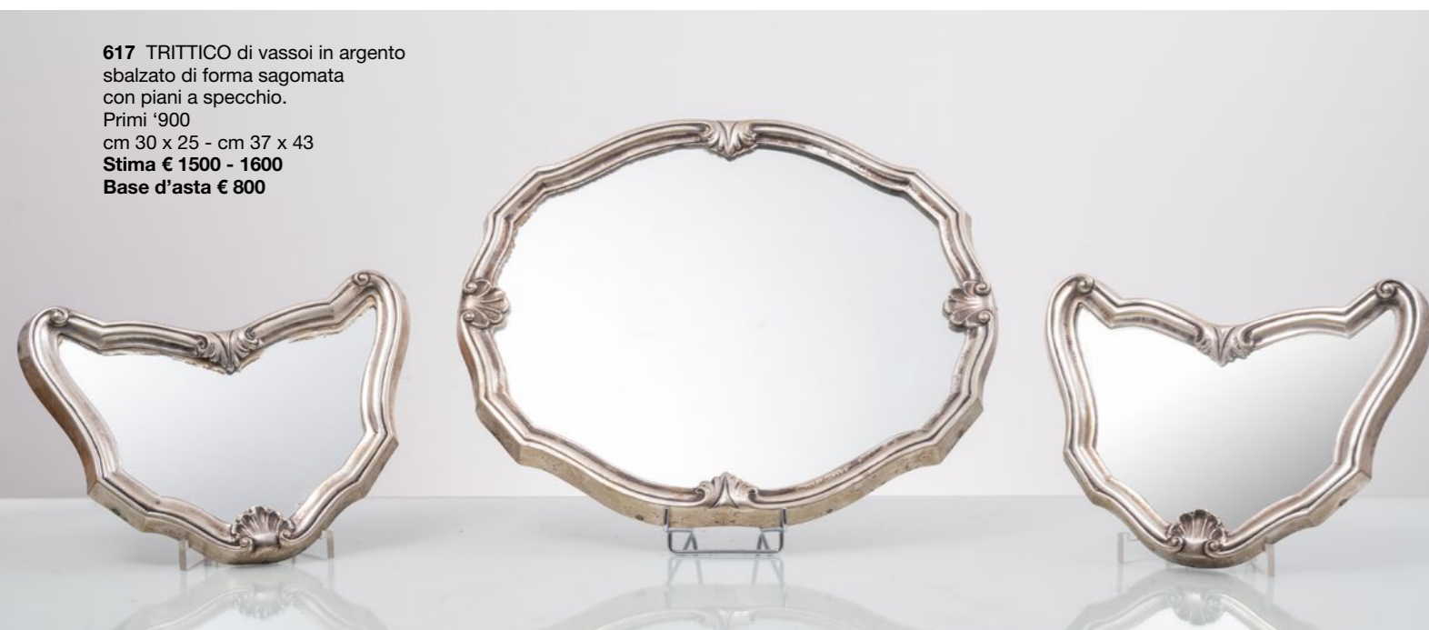
617 TRITTICO di vassoi in argento sbalzato di forma sagomata con piani a specchio. Primi '900 cm 30 x 25 - cm 37 x 43 Stima € 1500 - 1600 Base d'asta € 800