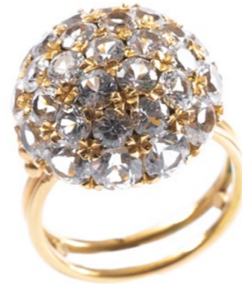
568 ANELLO in oro giallo 18 KT e zirconi (g. 9,10). Stima € 500 - 550 Base d'asta € 300