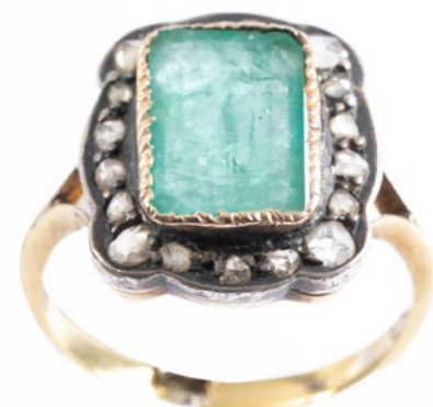
515 ANELLO in oro 9 KT e argento con smeraldo ct. 2,00 peso di stima e rosette ct. 0,23 (g. 3,55) (usure). Stima € 200 - 220 Base d'asta € 80