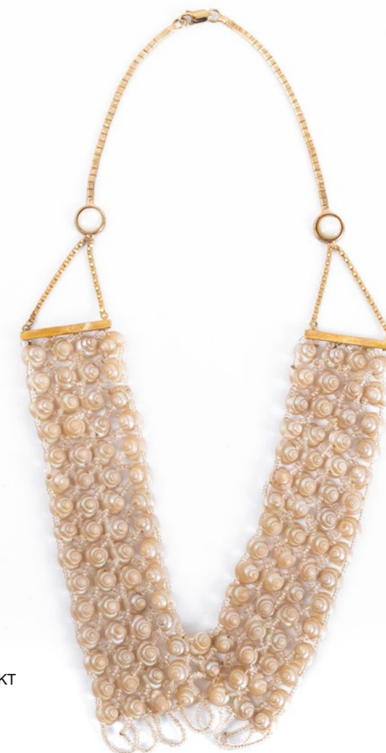
583 COLLANA in oro giallo 18 KT con conchiglie e cabochon in madreperla (g. 42,80). Stima € 750 - 850 Base d'asta € 400