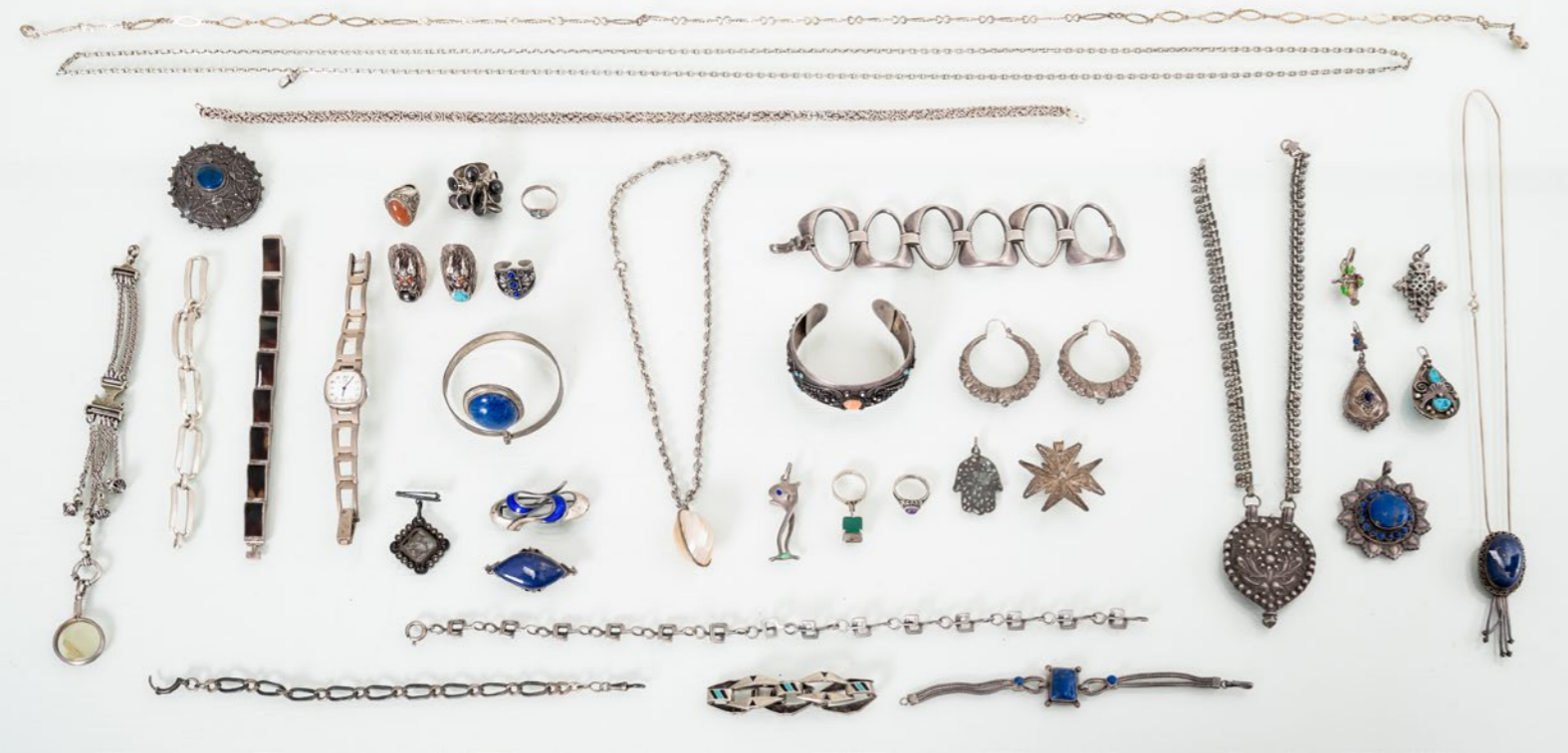
620 OGGETTI DI DIVERSA TIPOLOGIA IN ARGENTO (g. 816 peso lordo) (usure e mancanze). Stima € 680 - 720 Base d'asta € 320