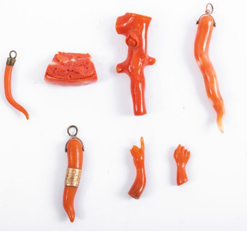
507 SETTE OGGETTI IN CORALLO Tre pendenti in corallo, oro e argento raffiguranti "Corni", piccolo tralcio di corallo, due coralli raffiguranti "Mani" e corallo raffigurante "Borsetta con farfalla" (usure). XX secolo Stima € 200 - 220 Base d'asta € 70