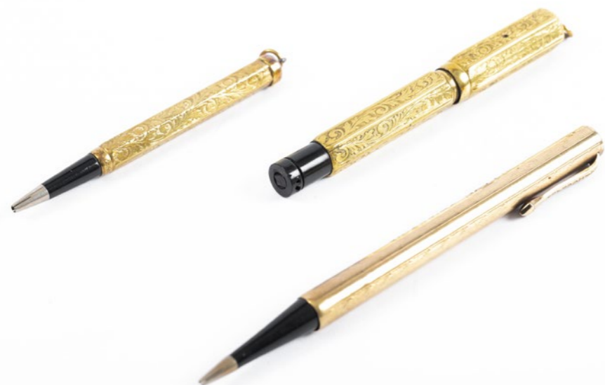
637 DUE MATITE E UNA PENNA Due matite di cui una marca Fendograph e una penna stilografica lamine in oro 18 KT (usure). Stima € 250 - 300 Base d'asta € 100