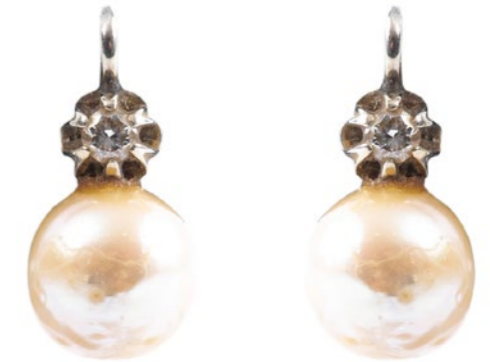
529 ORECCHINI in oro bianco 18 KT con perle coltivate Giappone e diamanti taglio brillante ct. 0,10 (g. 6,25). Stima € 300 - 400 Base d'asta € 120