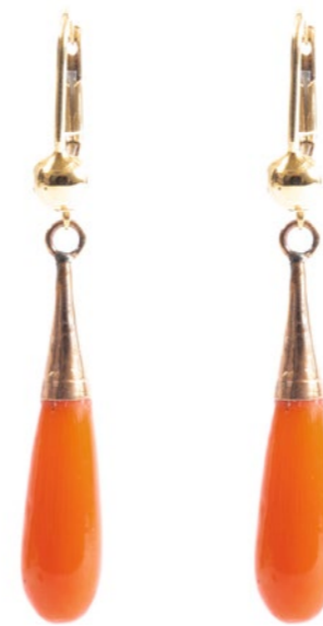
546 ORECCHINI in oro giallo 18 KT e 9 KT con pendenti in corallo rosso (g. 4,55). Sicilia XIX secolo Stima € 350 - 400 Base d'asta € 150