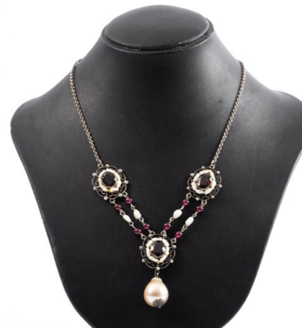
504 COLLANA in argento 835 con ametiste, perline di fiume e perla sintetica (g. 13,85) (usure). Stima € 120 - 140 Base d'asta € 50