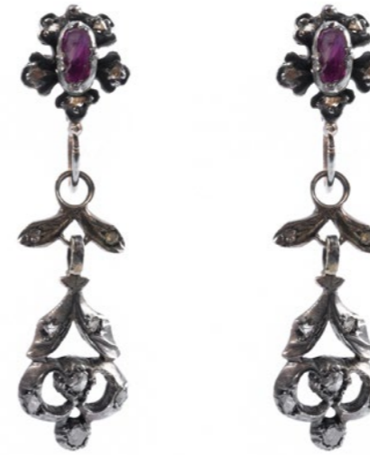
528 ORECCHINI in oro 9 KT e argento con diamanti vecchio taglio ct. 0,06 e rubini ct. 0,15 (g. 7,05). XIX secolo Stima € 400 - 500 Base d'asta € 100