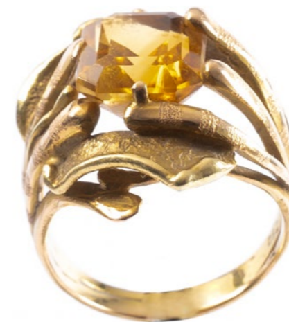
572 ANELLO in oro giallo 18 KT con quarzo citrino, firmato Bosio (g. 9,45). Stima € 450 - 500 Base d'asta € 300