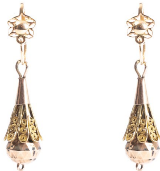
553 ORECCHINI in oro giallo 9 KT con diamanti taglio misto, perline e zaffiri (g. 10,60). XIX secolo Stima € 600 - 800 Base d'asta € 200