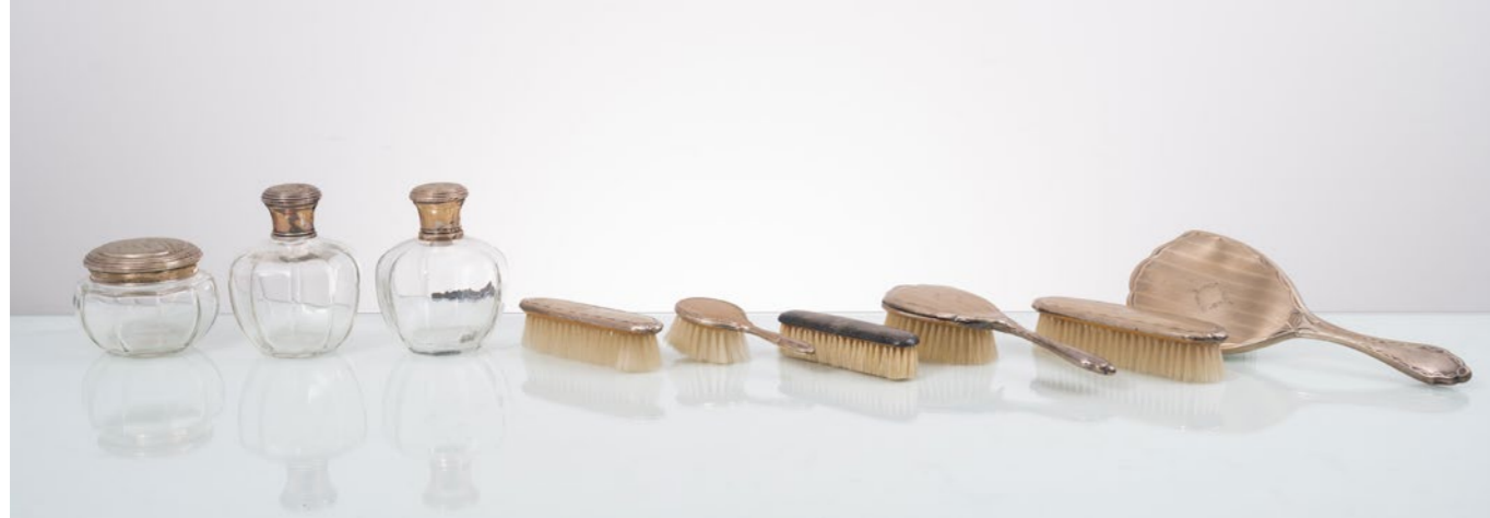
631 SET DA TOILETTA in argento composto da due bottiglie porta profumo, porta talco, cinque spazzole ed uno specchio (rotture, ammaccature e usure). Sicilia XX secolo Stima € 150 - 200 Base d'asta € 50