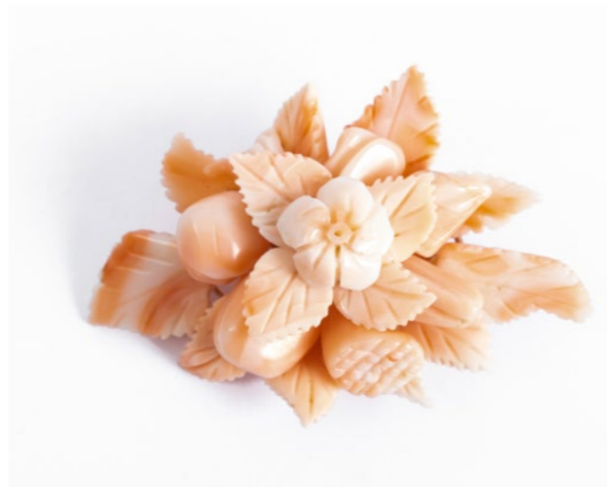
544 SPILLA in oro giallo 9 KT e corallo rosa lavorato a motivo floreale e fogliaceo (g. 51,80). Stima € 350 - 400 Base d'asta € 150