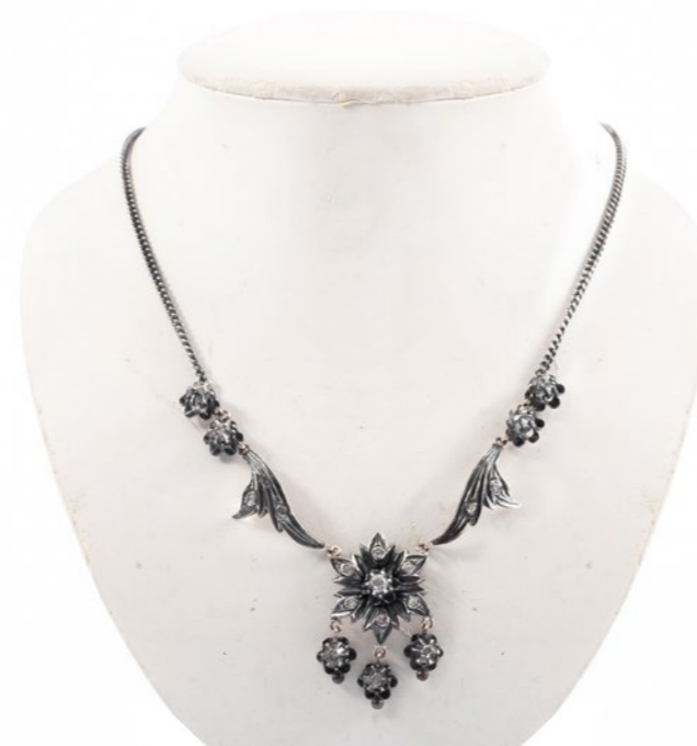
574 COLLANA in oro giallo 9 KT e argento con diamanti ct. 0,15 (g. 24,25). Anni '40 Stima € 650 - 700 Base d'asta € 300