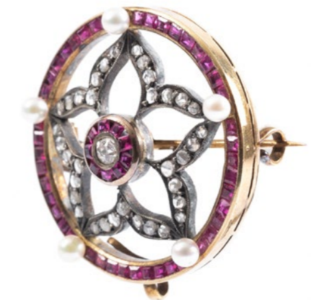
588 SPILLA in oro giallo 18 KT e argento con diamante vecchio taglio ct. 0,20, diamanti ct. 0,30, rubini ct. 1,00 peso di stima e cinque perline coltivate (g. 13,80). Stima € 1800 - 2000 Base d'asta € 600