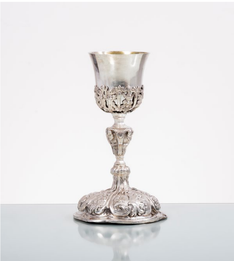
616 CALICE in argento sbalzato, interno della coppa in argento vermeil. Punzone usato negli anni 1725 - 1727 dal bollatore della zecca dello Stato Pontificio in Roma (usure, restauri e base sottostante in rame). cm Alt. 21,5 Stima € 1400 - 1600 Base d'asta € 500