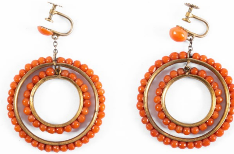
540 ORECCHINI in metallo dorato e sfere in corallo Trapani (g. 12,20). Stima € 350 - 380 Base d'asta € 150