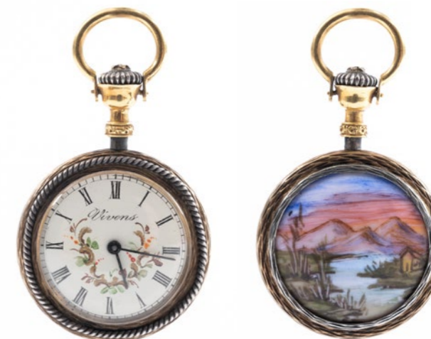
603 OROLOGIO DA TASCA in oro giallo 18 KT, argento e metallo dorato, quadrante dipinto con numeri romani, fondello con smalto dipinto raffigurante "Paesaggio" (da revisionare). Stima € 400 - 450 Base d'asta € 200