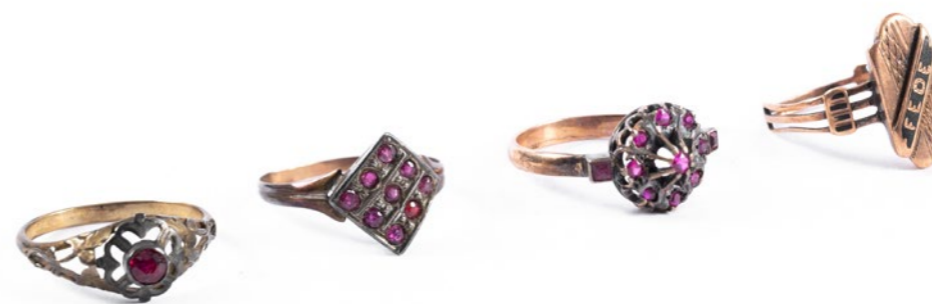
552 QUATTRO ANELLI Anello in oro giallo 9 KT e smalto e tre anelli in oro giallo 9 KT e argento con rubini sintetici (g. 9,20). Stima € 380 - 420 Base d'asta € 200