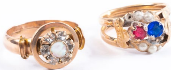
521 DUE ANELLI Anello in oro giallo 9 KT con madreperla e zaffiri bianchi e anello in oro giallo 18 KT con perline e pietre colorate (g. 5,05) (usure e mancanza). Stima € 300 - 350 Base d'asta € 100