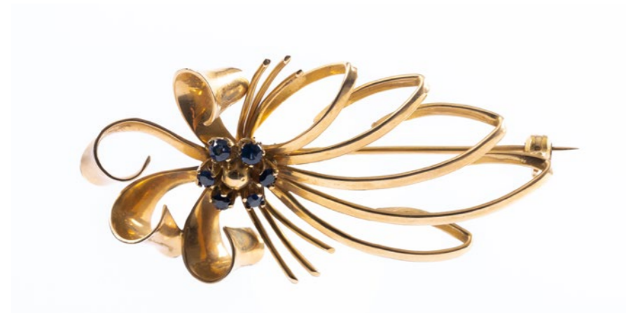
539 SPILLA in oro giallo 18 KT e zaffiri ct. 0,18 peso di stima (g. 9,90). Stima € 600 - 700 Base d'asta € 200