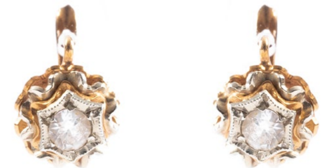
517 ORECCHINI in oro giallo 18 KT con zaffiri bianchi (g. 4,00). Stima € 250 - 300 Base d'asta € 100