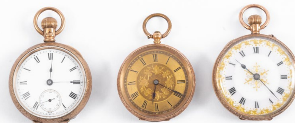
604 TRE OROLOGI DA TASCA Orologio in oro lavorato 14 KT con doppia cassa in metallo, quadrante con numeri romani; orologio Waltham in oro lavorato 9 KT, quadrante smaltato con numeri romani e orologio Patent 6577 in oro lavorato 9 KT e doppia cassa in metallo, quadrante smaltato con numeri romani (usure e da revisionare). Stima € 900 - 1000 Base d'asta € 300