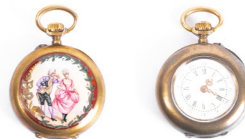
602 OROLOGIO DA TASCA REMONTOIR CYLINDRE 10 rubis in oro giallo 18 KT, quadrante smaltato con numeri romani e smalto dipinto raffigurante "Gentildonna e nobileuomo", numero 21635 con catena in oro giallo 9 KT (da revisionare). Stima € 500 - 600 Base d'asta € 250