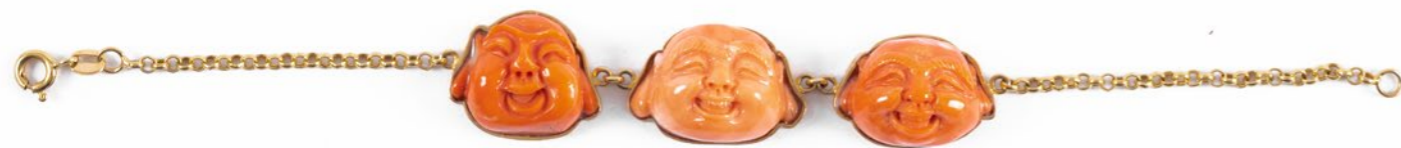
589 BRACCIALE in oro giallo 18 KT e corallo lavorato raffigurante "Volto di Buddha" (g. 19,30). Stima € 1300 - 1400 Base d'asta € 700