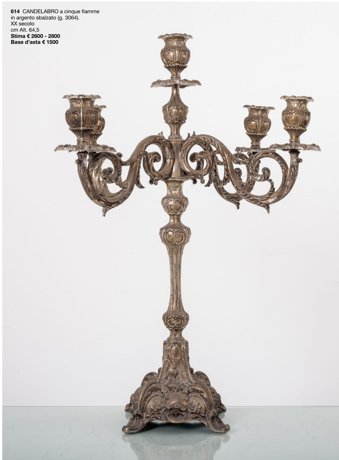
614 CANDELABRO a cinque fiamme in argento sbalzato (g. 3064). XX secolo cm Alt. 64,5 Stima € 2600 - 2800 Base d'asta € 1500