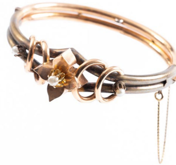
570 BRACCIALE in oro giallo 9 KT con perline (g. 14,55) Sicilia seconda meta XIX secolo Stima € 550 - 600 Base d'asta € 300