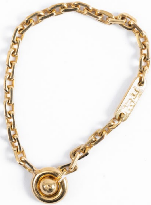
567 BRACCIALE per neonato in oro giallo 18 KT (g. 7,30). Stima € 370 - 420 Base d'asta € 290