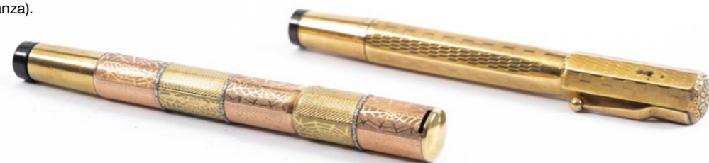
638 DUE PENNE stilografiche lamine oro 18 KT (usure e mancanza). Stima € 250 - 300 Base d'asta € 130