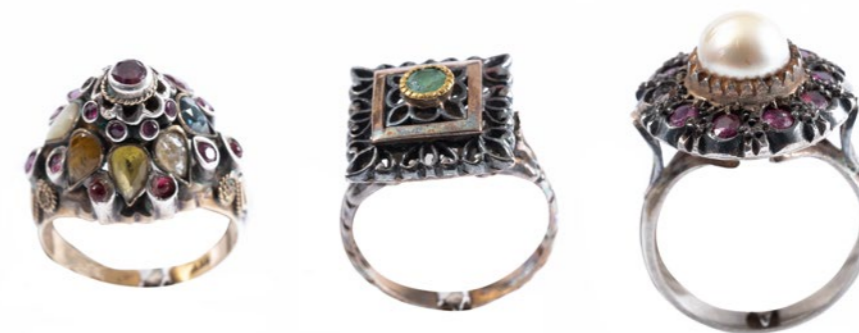
591 TRE ANELLI in oro 9 KT e argento Anello con smeraldo centrale ct. 0,05, anello con rubini ct. 0,10, perla sintetica e pietra naturale e anello con pietre naturali ct. 0,20 (usure) (g. 19,95). Stima € 450 - 500 Base d'asta € 200