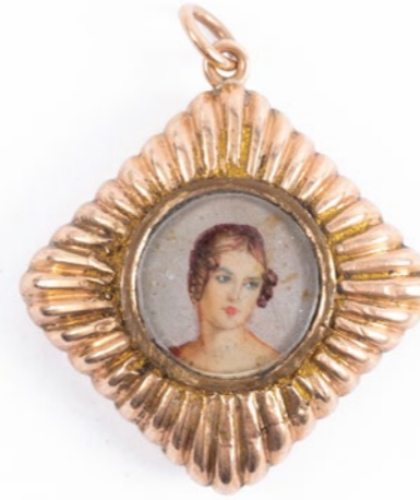
522 CIONDOLO in oro giallo 9 KT con miniatura dipinta raffigurante "Mezzo busto femminile" (g. 6,95) (usure). XIX secolo Stima € 250 - 300 Base d'asta € 100