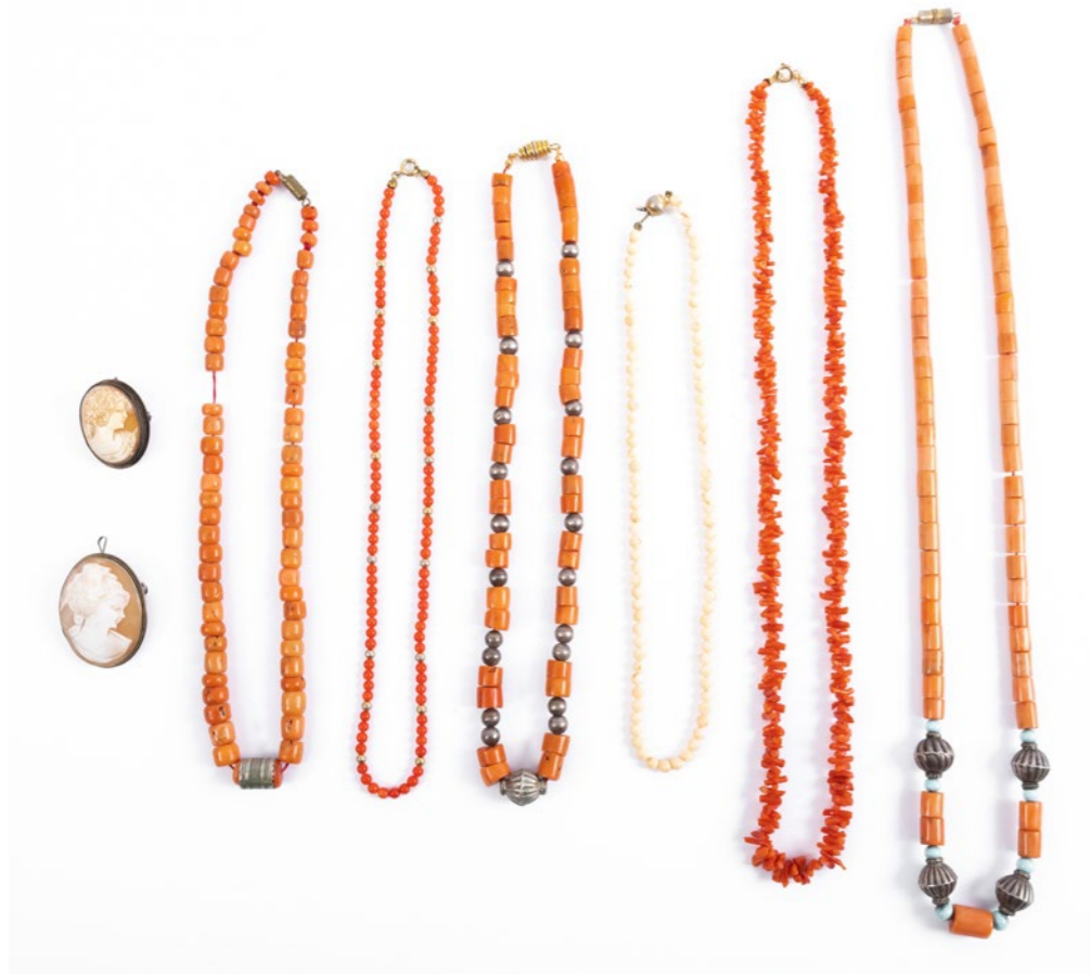
513 SEI COLLANE E DUE CAMMEI Sei collane di diversa tipologia in corallo e due cammei lavorati raffiguranti "Mezzo busto femminile" con cornice in argento e una in metallo (usure). Stima € 250 - 300 Base d'asta € 70