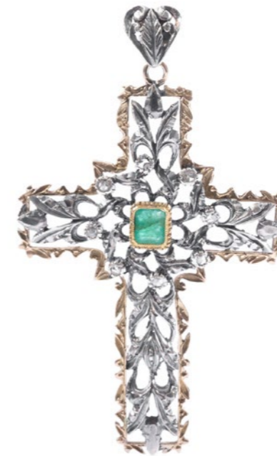
564 PENDENTE a forma di croce in oro giallo 9 KT e argento con smeraldo ct. 0,50 peso di stima e diamanti tre facce ct. 0,05 (g. 10,00). Stima € 500 - 600 Base d'asta € 250