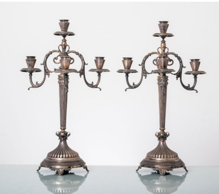
611 COPPIA DI CANDELABRI a cinque fiamme in argento sbalzato. Argentiere Peruggia & C. - Alessandria (g. 3554). Anni '50 cm Alt. 47 Stima € 3000 - 3200 Base d'asta € 300