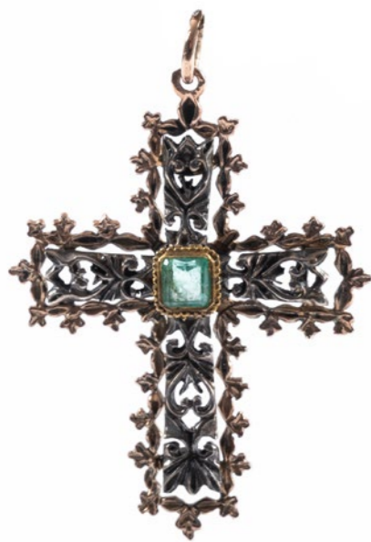
581 PENDENTE a forma di croce in oro giallo 9 KT e argento con smeraldo ct. 0,25 (g. 5,50) (usure). Stima € 380 - 420 Base d'asta € 200