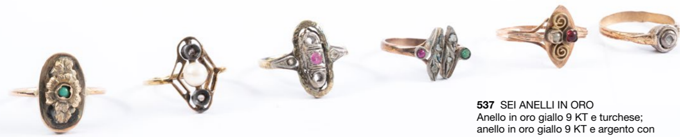
537 SEI ANELLI IN ORO Anello in oro giallo 9 KT e turchese; anello in oro giallo 9 KT e argento con diamante tre facce; anello in oro giallo 9 KT con diamanti, smeraldo ct. 0,03 e pietra colorata; anello in oro giallo 12 KT e argento con rubino e zaffiri bianchi; anello in oro giallo 9 KT con granato e perlina e anello in oro giallo 9 KT con perla e due diamanti tre facce (g.12,25) (usure e mancanze). Sicilia XIX secolo Stima € 450 - 500 Base d'asta € 150