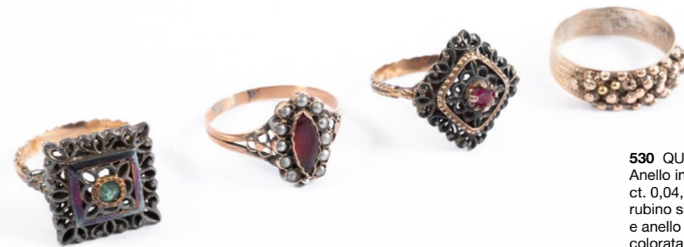
530 QUATTRO ANELLI Anello in oro 9 KT e argento con smeraldo ct. 0,04, anello in oro 9 KT e argento con rubino sintetico, anello in oro 9 KT lavorato e anello in oro 9 KT con perline e pietra colorata (g. 13,50) (usure e saldature). XIX - XX secolo Stima € 450 - 500 Base d'asta € 130