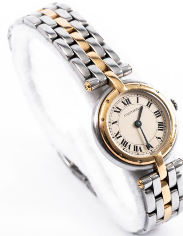
594 OROLOGIO CARTIER SANTOS RONDE in oro giallo 18 KT e acciaio, movimento al quarzo entro custodia originale e certificato di garanzia, numero di serie 105792020251. Anni '90 Stima € 1800 - 2000 Base d'asta € 950