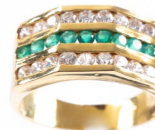
578 ANELLO in oro giallo 18 KT con diamanti taglio brillante ct. 0,60 e smeraldi ct. 0,30 (g. 7,20). Stima € 1000 - 1200 Base d'asta € 350