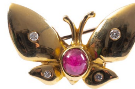
577 DUE SPILLE Spilla in oro giallo 18 KT a guisa di farfalla con diamanti taglio brillante ct. 0,06 H COLOR VS1 e cabochon di rubino ct. 0,08 e una spilla in oro giallo 18 KT a guisa ferro di cavallo e piccolo corno in corallo rosso (g. 10,60) (piccola usura). Stima € 600 - 700 Base d'asta € 200