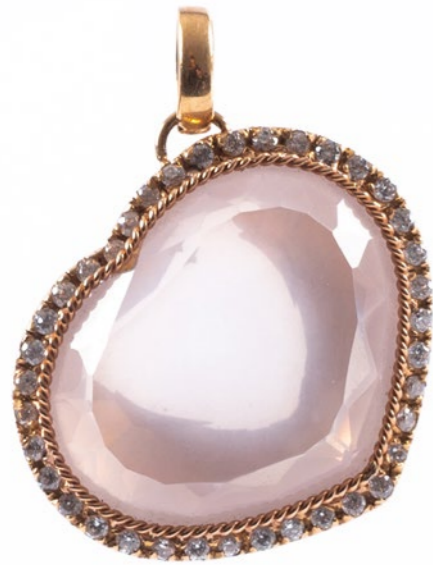
53 PENDENTE a forma di cuore oro giallo 18 KT con zirconi quarzo rosa (g. 11,15). Stima € 550 - 600 Base d'asta € 300