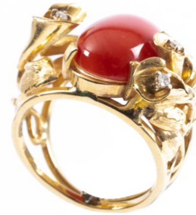
586 ANELLO in oro giallo lavorato 18 KT con diamanti taglio brillante ct. 0,06 | COLOR SI2 e cabochon in corallo rosso (g. 12,40) Stima € 900 - 1000 Base d'asta € 450