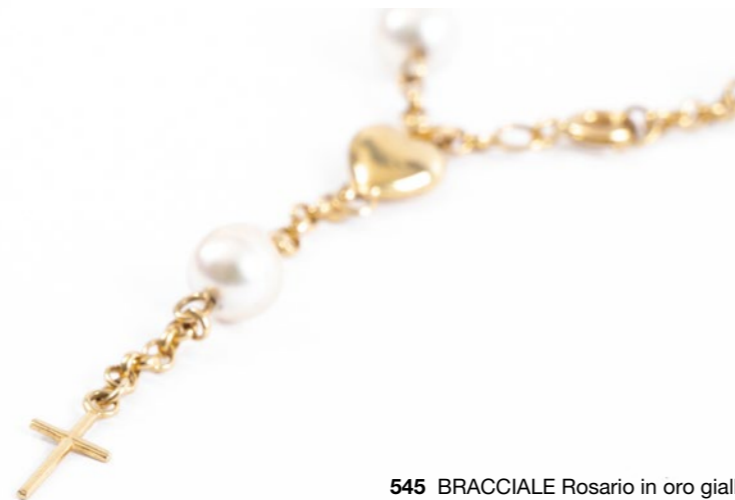
545 BRACCIALE Rosario in oro giallo 18 KT con perle coltivate Giappone (g. 9,40). Stima € 330 - 360 Base d'asta € 150