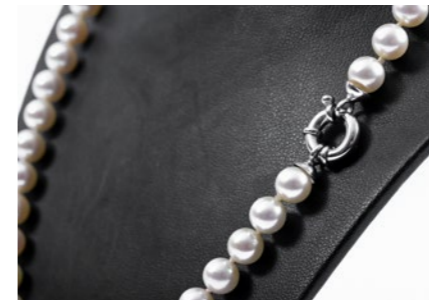
587 COLLANA DI PERLE coltivate Giappone mm. 8,00, susta in oro bianco 18 KT (g. 37,05). Stima € 900 - 1000 Base d'asta € 500