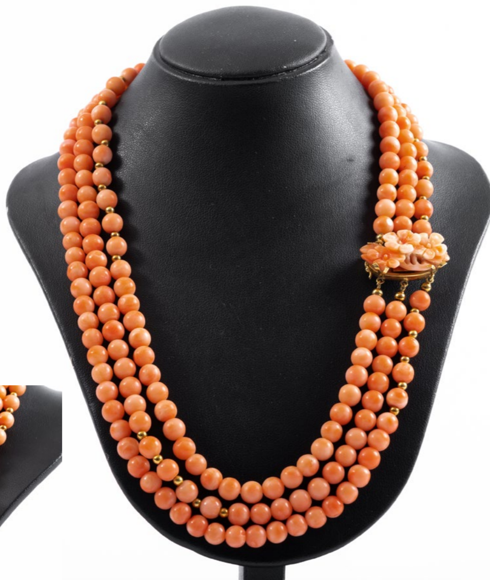
590 COLLANA a tre fili di corallo rosa con susta in oro giallo 18 KT e corallo lavorato a motivo floreale, divisori in oro (g. 94,00). Stima € 1300 - 1500 Base d'asta € 700