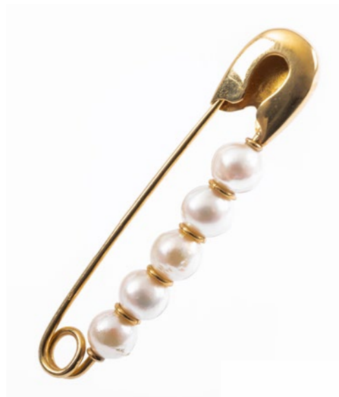
579 SPILLA in oro giallo 18 KT con cinque perle Giappone (g. 15,50) (usure). Stima € 600 - 650 Base d'asta € 350