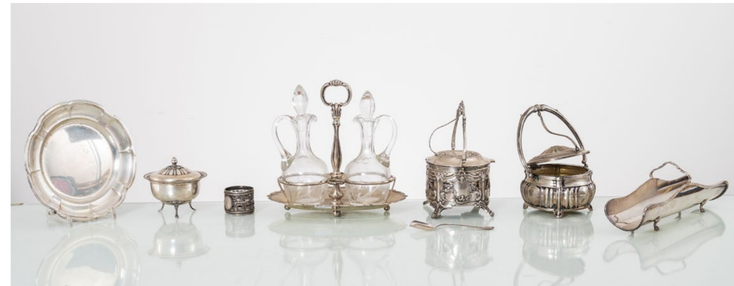
623 SETTE OGGETTI DI DIVERSA TIPOLOGIA Porta grissini, ménage con bottiglie in vetro, piattino, zuccheriera, due formaggiere di cui una con cucchiaino adattato con vaschette in vetro ed un porta tovaglioli (g. 965) (usure ed ammaccature). XX secolo cm Alt. 22,5 (ménage) Stima € 650 - 750 Base d'asta € 100