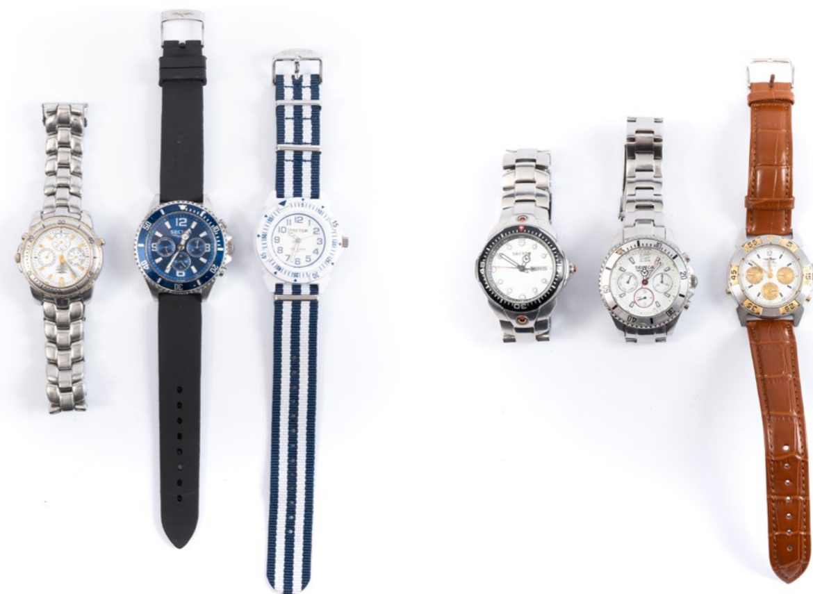
641 TRE OROLOGI Orologio Sector ADV 5500 in acciaio con cronografo, orologio Sector 230 in acciaio con cronografo, cinturino in gomma e orologio Sector Expander 90 (usure). Stima € 380 - 400 Base d'asta € 200