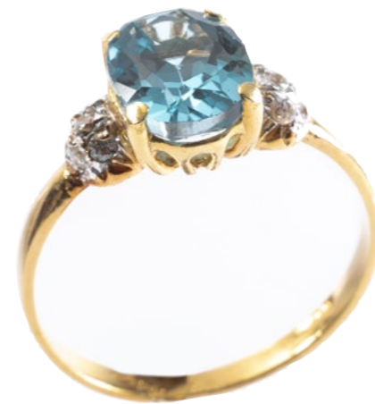
514 ANELLO in oro giallo 18 KT con quarzo sintetico centrale e zirconi (g. 2,90). Stima € 170 - 200 Base d'asta € 90