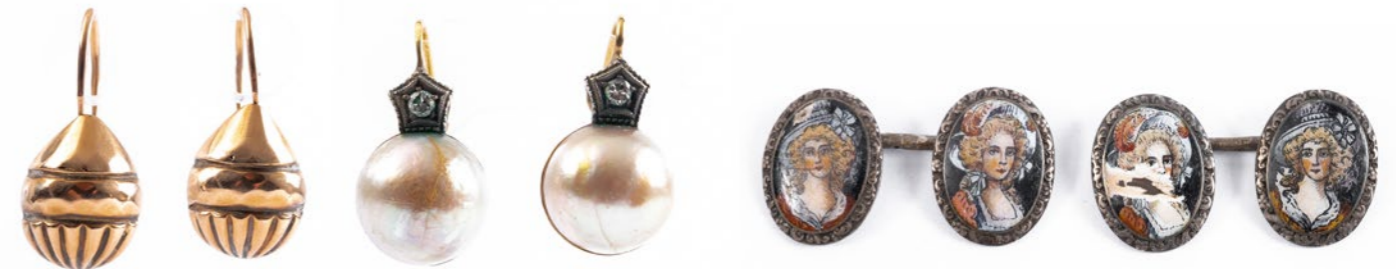
524 DUE COPPIE DI ORECCHINI E FERMAPOLSI Orecchini in oro giallo 9 KT, orecchini in oro giallo 18 KT con diamanti tagli brillanti ct. 0,09 e perle mabe e fermapolsi in argento con miniature dipinte raffiguranti "Mezzi busti femminili" (g. 10,35) (fermapolsi g. 8,45) (usure e rotture). Stima € 400 - 450 Base d'asta € 100