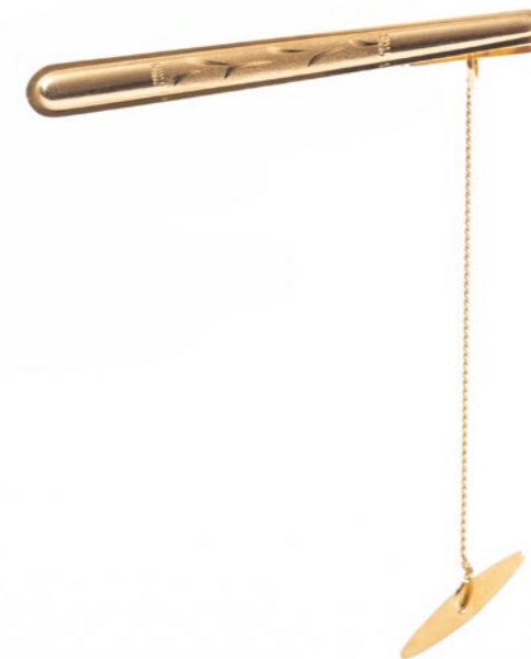
518 FERMACRAVATTE in oro giallo 18 KT (g. 3,55). Stima € 170 - 200 Base d'asta € 120