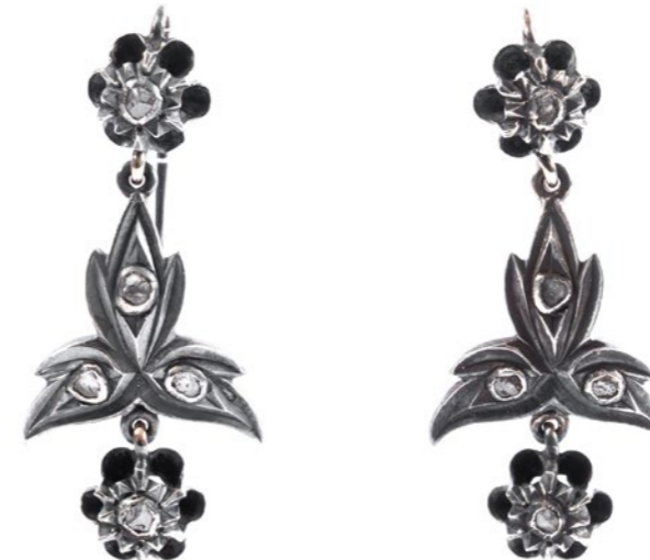
542 ORECCHINI in oro 9 KT e argento con diamanti ct. 0,10 (g. 8,15). Anni '40 Stima € 350 - 400 Base d'asta € 150