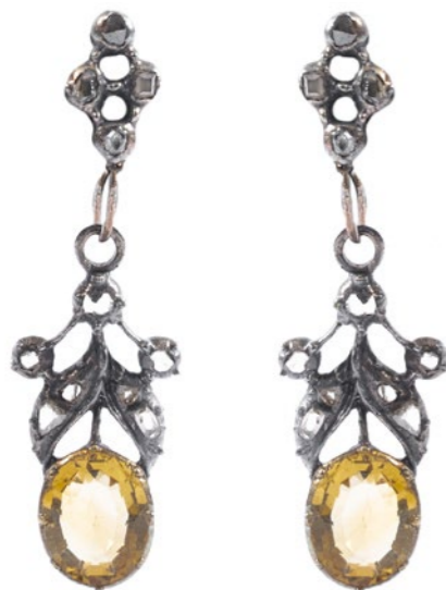
527 ORECCHINI in oro 9 KT e argento con diamanti vecchio taglio ct. 0,08 e pietre sintetiche (quattro diamanti mancanti) (g. 5,85). Stima € 200 - 300 Base d'asta € 100