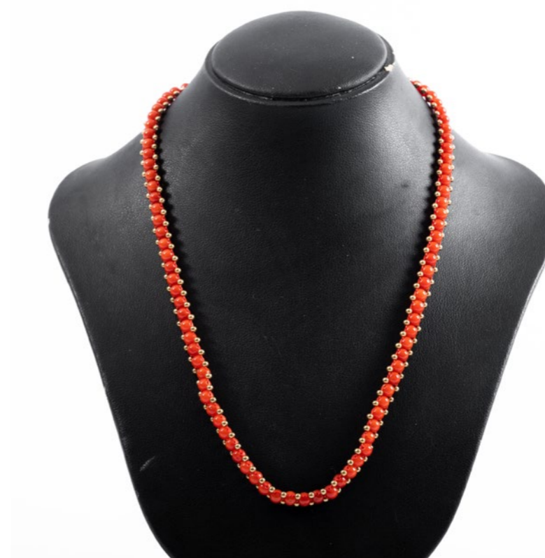
534 COLLANA con sfere di corallo rosso Mediterraneo, chiusura e divisori in oro giallo 18 KT (g. 11,40). Stima € 350 - 400 Base d'asta € 150