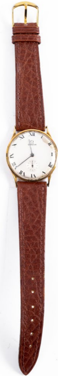
597 OROLOGIO OMEGA con cassa in oro giallo 18 KT, carica manuale, cinturino in pelle non originale (usure e da revisionare). Anni '70 Stima € 350 - 400 Base d'asta € 150