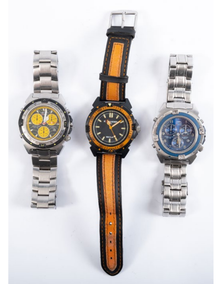
646 TRE OROLOGI Orologio Sector Expander 202 in acciaio con cronografo, orologio Sector Expander 202 in acciaio con cronografo e orologio Sector Expander 90 (usure). Stima € 250 - 300 Base d'asta € 120