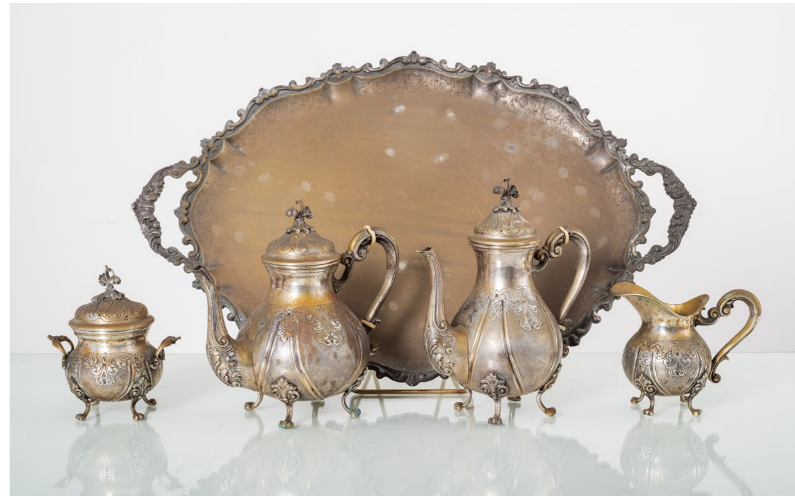
615 SERVIZIO composto da caffettiera, teiera, lattiera, zuccheriera e vassoio in argento sbalzato e cesellato. Argentiere Vallè - Milano (g. 4306). Anni' 70 Stima € 3800 - 4000 Base d'asta € 2400