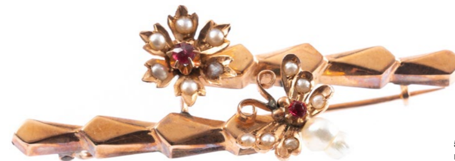
512 SPILLA in oro giallo 9 KT con microperline e rubini ct. 0,04 (g. 2,75). Stima € 280 - 300 Base d'asta € 70