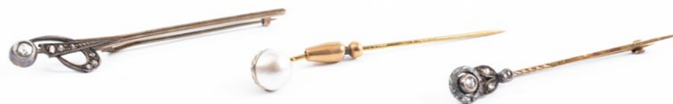
502 DUE SPILLE E UNO SPILLONE Spilla in oro giallo 12 KT e argento con diamanti ct. 0,06, spilla in oro giallo 9KT e argento con diamanti ct. 0,13 e spillone in oro giallo 12 KT e perla mabe (g. 8,35) (usure). Stima € 250 - 300 Base d'asta € 50