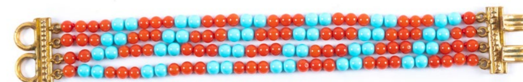
554 BRACCIALE a quattro fili con sfere di corallo e pasta di turchese, chiusura in argento 925 dorato (g. 37,25). Stima € 350 - 380 Base d'asta € 180