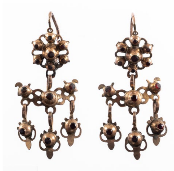
525 ORECCHINI in oro giallo 9 KT con rubini e pietre sintetiche (g. 9,80) (usure e mancanza). Piana degli Albanesi XVIII secolo Stima € 350 - 400 Base d'asta € 100