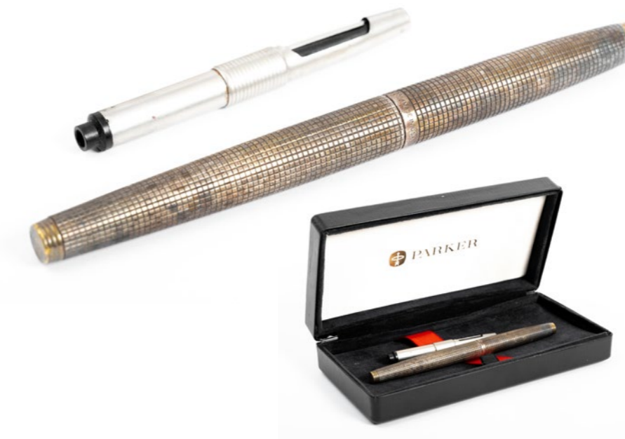
636 PARKER Penna stilografica in argento sterling e pennino in oro giallo 14 KT entro scatola. Stima € 220 - 240 Base d'asta € 50