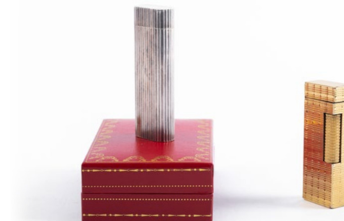
635 DUE ACCENDINI Accendino Cartier in metallo argentato entro cofanetto originale e accendino Dunhill laminato in oro, U.S. patented (usure e da revisionare). Stima € 200 - 300 Base d'asta € 50