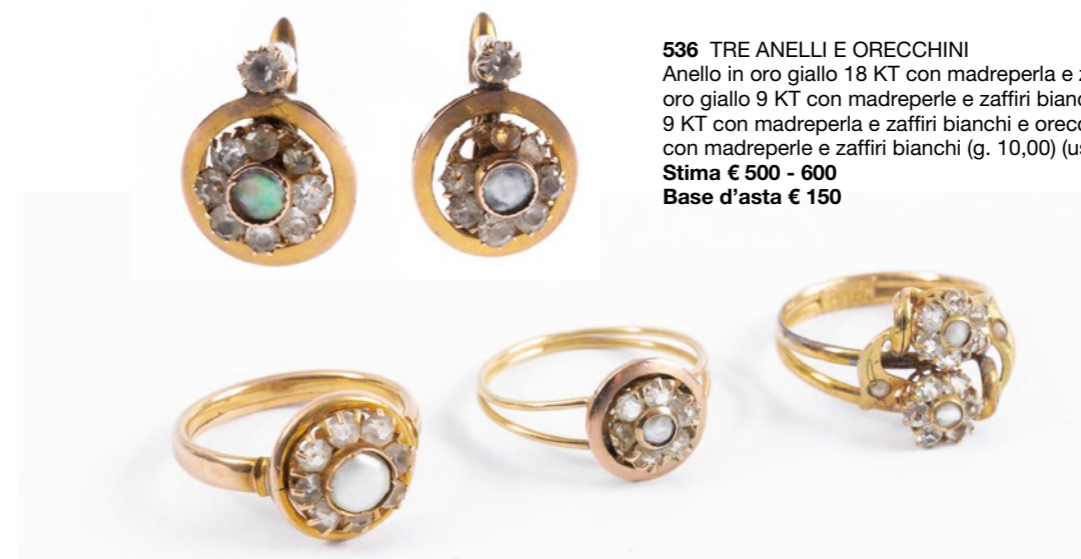
536 TRE ANELLI E ORECCHINI Anello in oro giallo 18 KT con madreperla e zaffiri bianchi, anello in oro giallo 9 KT con madreperle e zaffiri bianchi, anello in oro giallo 9 KT con madreperla e zaffiri bianchi e orecchini in oro giallo 9 KT con madreperle e zaffiri bianchi (g. 10,00) (usure e mancanza). Stima € 500 - 600 Base d'asta € 150