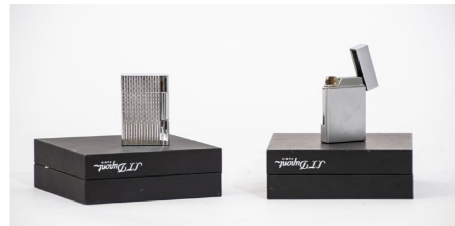
634 S.T. DUPONT Due accendini in acciaio entro custodie originali (graffi). Alt. cm 5,5 Stima € 450 - 500 Base d'asta € 50