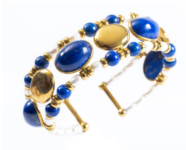
582 BRACCIALE in oro giallo 18 KT con sfere e cabochon in lapis e perline (g. 26,00). Stima € 800 - 900 Base d'asta € 450