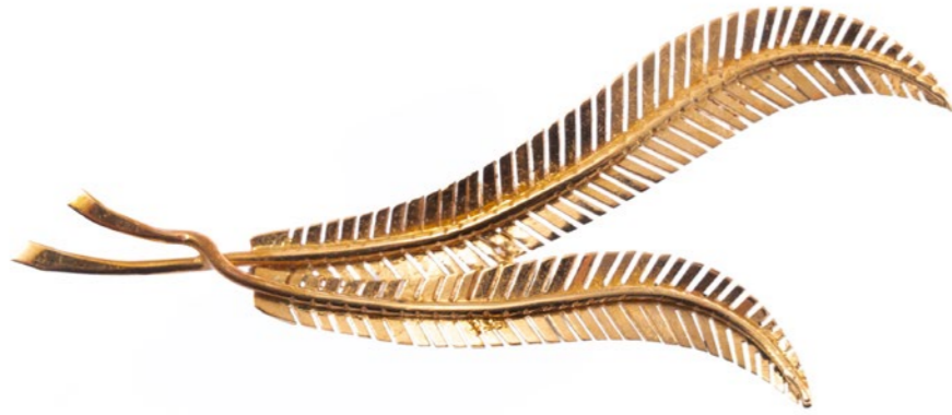
519 SPILLA in oro giallo 18 KT a guisa di foglie (g. 3,40). Stima € 250 - 280 Base d'asta € 140