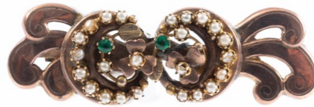
526 SPILLA in oro giallo 9 KT con perline e pietre colorate (g. 7,80). Fine '800 Stima € 400 - 450 Base d'asta € 100