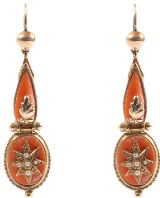
569 ORECCHINI in oro giallo 9KT con corallo e microperline (g. 7,65). Sciaccà XIX secolo Stima € 500 - 600 Base d'asta € 300