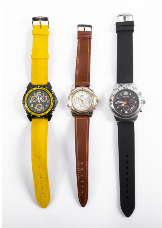
643 TRE OROLOGI Orologio Sector ADV 1500 cassa in acciaio con cronografo e cinturino in pelle marrone, orologio Sector Expander 90 con cronografo e orologio Sector Expander 308 in acciaio con cronografo e cinturino in gomma (usure). Stima € 300 - 350 Base d'asta € 150