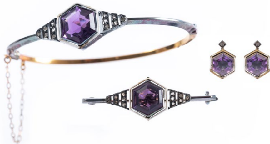
580 PARURE in oro bianco e giallo 18 KT composta da bracciale rigido, spilla e orecchini con diamanti ct. 0,20, ametiste e smalti bianchi (g. 17,95). Stima € 1000 - 1200 Base d'asta € 250