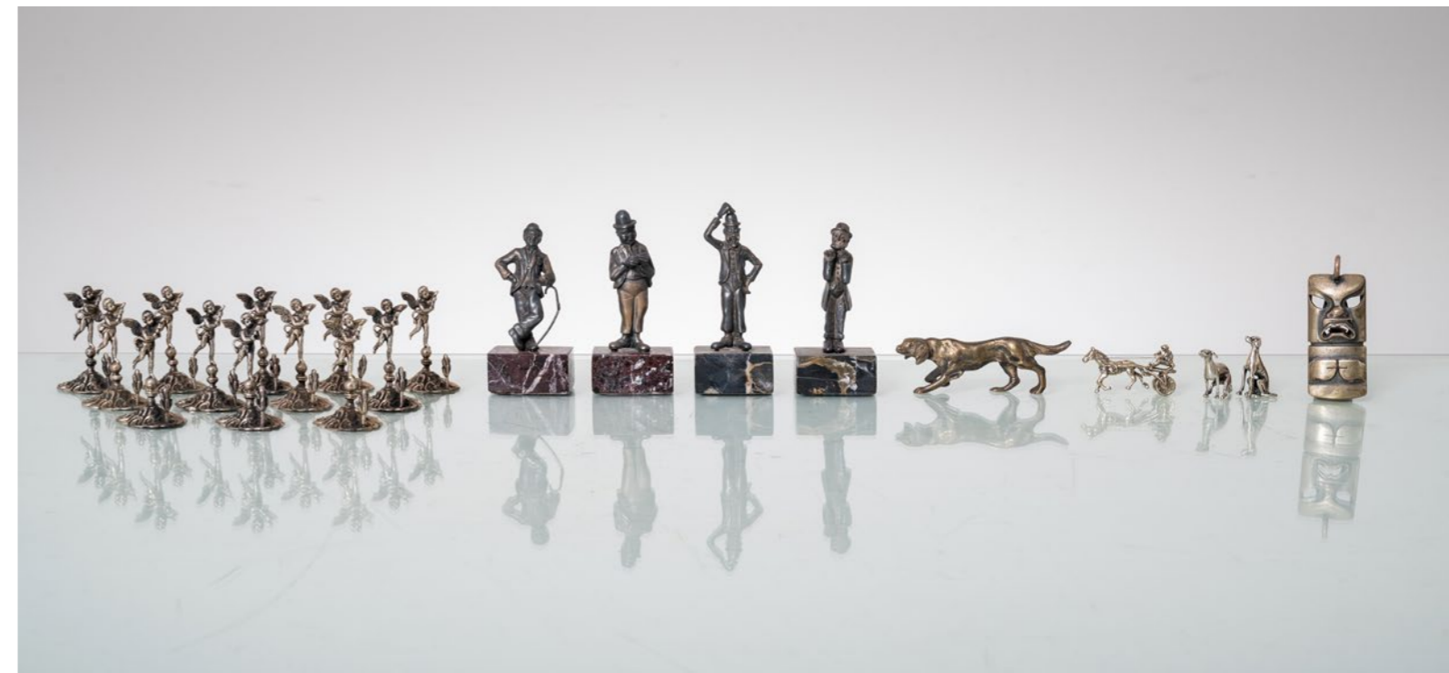
624 COLLEZIONE DI PICCOLE SCULTURE in argento di diversa tipologia (g. 725 peso lordo). XX secolo cm Alt. 7 Stima € 600 - 650 Base d'asta € 100