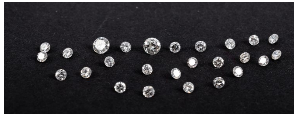
585 DIAMANTI TAGLIO MISTO, 2 SMERALDI UN RUBINO SINTETICO E 2 PERLE Diamanti taglio brillante ct. 6,07 | COLOR VS2, diamanti taglio huit/huit ct. 1,48, due smeraldi ct. 1,05, rubino sintetico e coppia di perle Giappone intere. Stima € 1100 - 1300 Base d'asta € 650