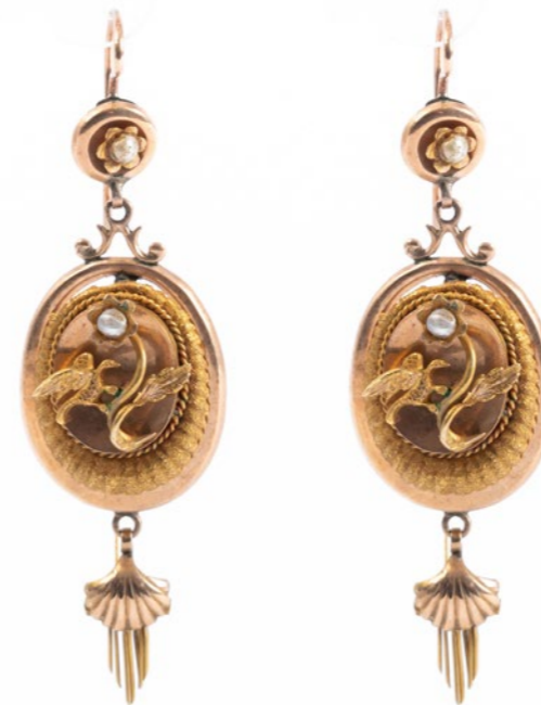
548 ORECCHINI in oro giallo lavorato 9 KT con perline (g. 7,70). Sicilia XIX secolo Stima € 500 - 550 Base d'asta € 150