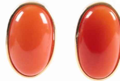
576 ORECCHINI in oro giallo 18 KT e corallo (g. 7,80). Stima € 650 - 700 Base d'asta € 380