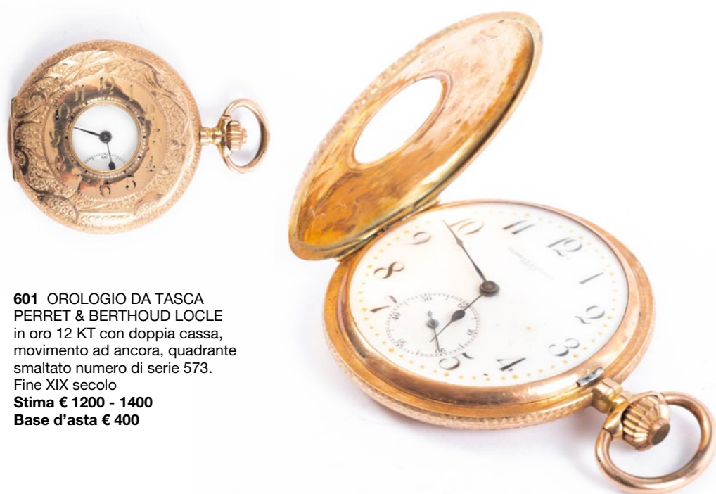
601 OROLOGIO DA TASCA PERRET & BERTHOUD LOCLE in oro 12 KT con doppia cassa, movimento ad ancora, quadrante smaltato numero di serie 573. Fine XIX secolo Stima € 1200 - 1400 Base d'asta € 400