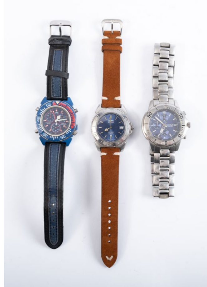
644 TRE OROLOGI Orologio Sector ADV 4500 in acciaio con cinturino non originale, orologio Sector Underlab con cronografo e orologio Sector 200 in acciaio con cronografo (usure). Stima € 250 - 300 Base d'asta € 150