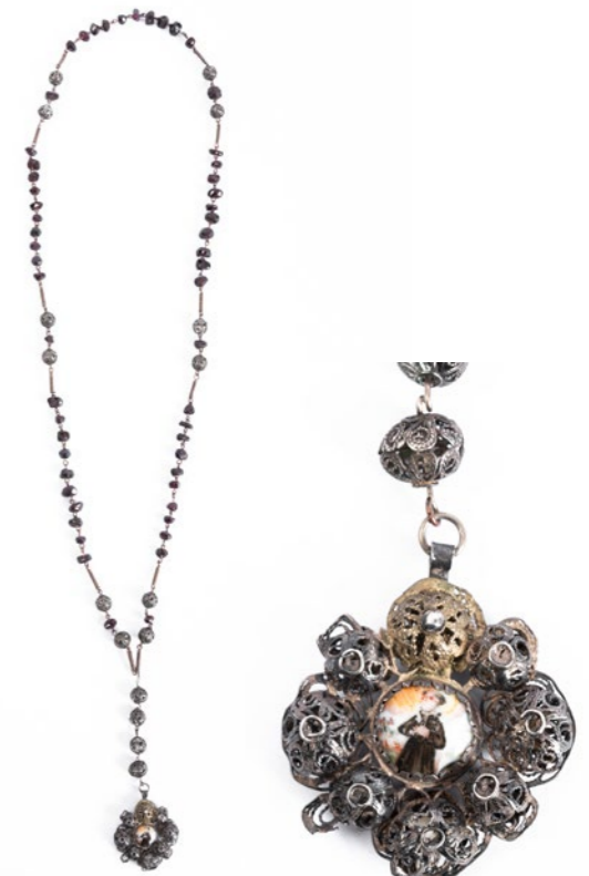
547 COLLANA in filigrana d'argento con granati e smalto dipinto raffigurante "Santo" (g. 55,25) (usure). Stima € 250 - 300 Base d'asta € 150