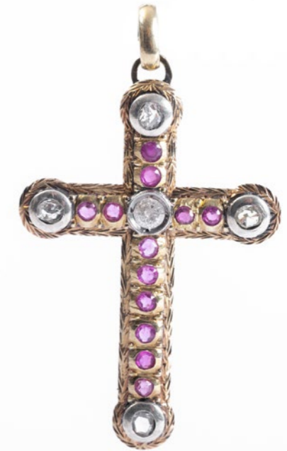
565 PENDENTE a forma di croce in oro giallo 9 KT con diamante centrale taglio brillante ct. 0,15 K COLOR I3, diamanti tre facce ct. 0,03 e rubini ct. 0,15 peso di stima (g. 8,40). Stima € 400 - 500 Base d'asta € 250