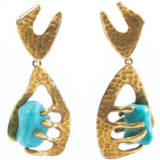
571 ORECCHINI in oro giallo 18 KT e pietre dure firmati Bosio con chiusura a clip (g. 13,50). Stima € 500 - 550 Base d'asta € 300