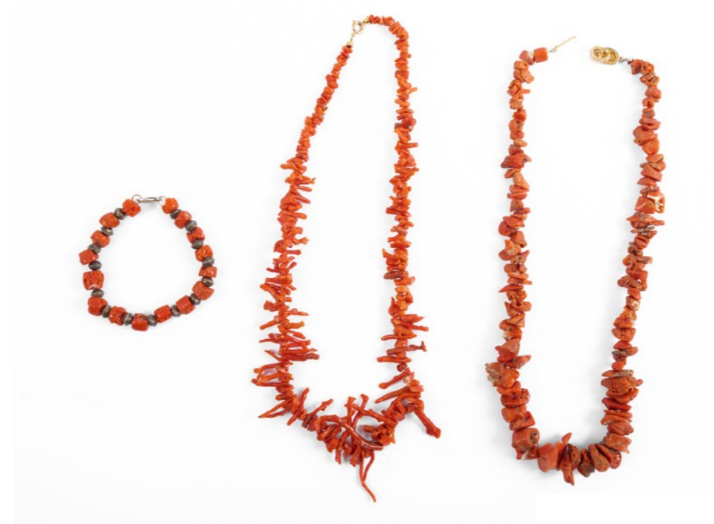
516 DUE COLLANE E UN BRACCIALE Due collane in corallo, ganci in metallo dorato e un bracciale in corallo con gancio e divisori in metallo (rottura in una susta). Stima € 250 - 300 Base d'asta € 100