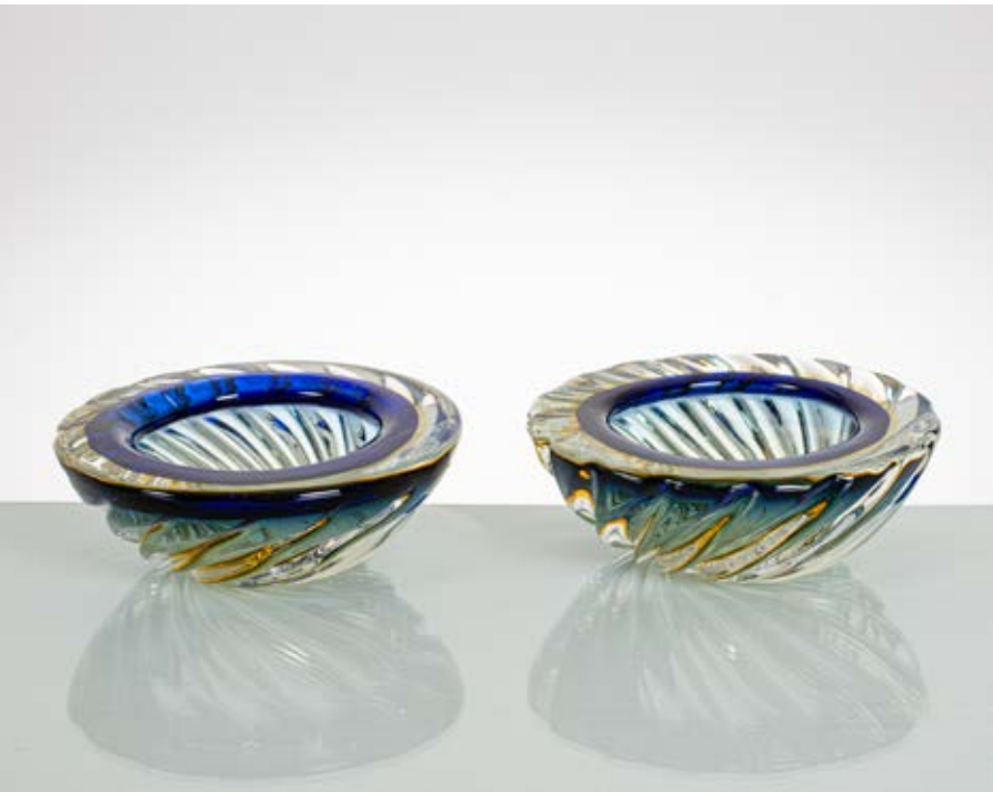
152 FLAVIO POLI Produzione Seguso, Italia 1960 ca. Coppia di ciotole in vetro sommerso incolore, paglierino e blu, corpo semisferico a costole diagonali, bocca circolare. cm Ø 17,5 Alt. 6

Bibliografia: Catalogo altra casa d'aste.