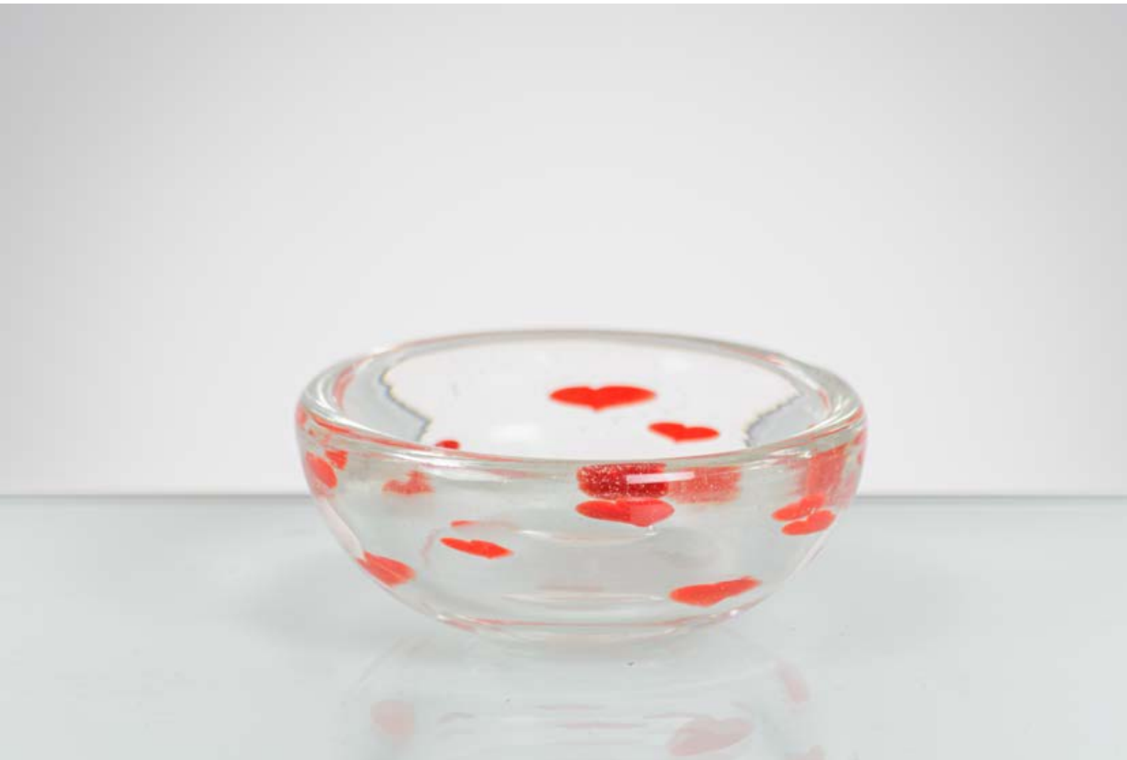
99 CARLO SCARPA Produzione Venini, Italia 1938 ca. Coppa a "Puntini" in cristallo incolore e punti in pasta vitrea rossa, corpo semi globulare. Presentato alla mostra Internazionale di Parigi. Firma all'acido alla base Venini, Murano. cm Ø 9 - Alt. 3,5

Bibliografia: Carlo Scarpa - I Vetri di un Architetto, M.Barovier, Skira, 1999, pag.131 e 212. Catalogo della Mostra Venini 1932 - 1947, tenuta presso la Fondazione Chini di Venezia dal 29 Agosto 2012 al 6 Gennaio 2013, Skira, 2012, pag.228 e 232. Domus n.125, Maggio 1938, pag.45.