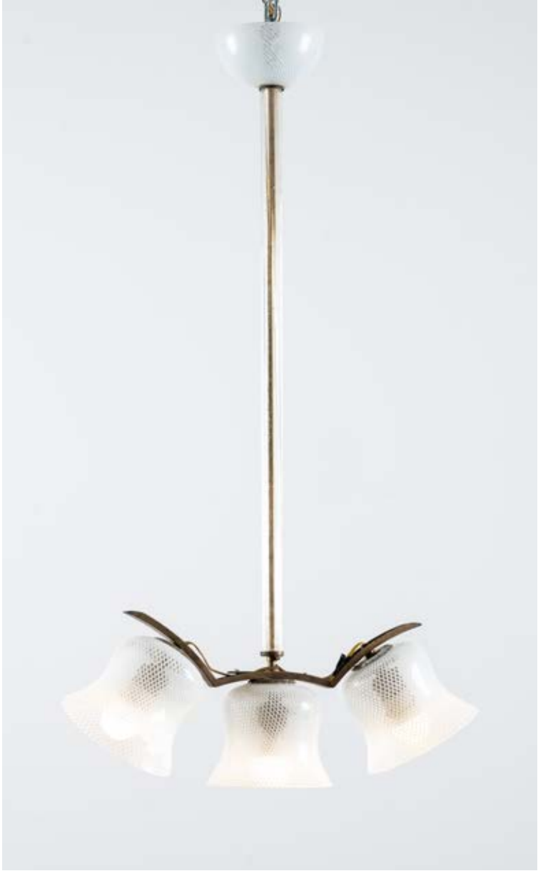
TRIONFANTE CASA D'ASTE | VENERDÌ 23 GENNAIO 2026 157 VENINI Produzione Murano, Italia 1940 ca. Lampada a sospensione a tre luci, struttura in ottone con tre diffusori a tulipano sagomata in vetro a reticello. cm Alt. 87 Bibliografia: Catalogo Altra casa d'aste. A SUSPENSION LAMP BY VENINI. Stima € 1500 - 1800 Base d'asta € 600