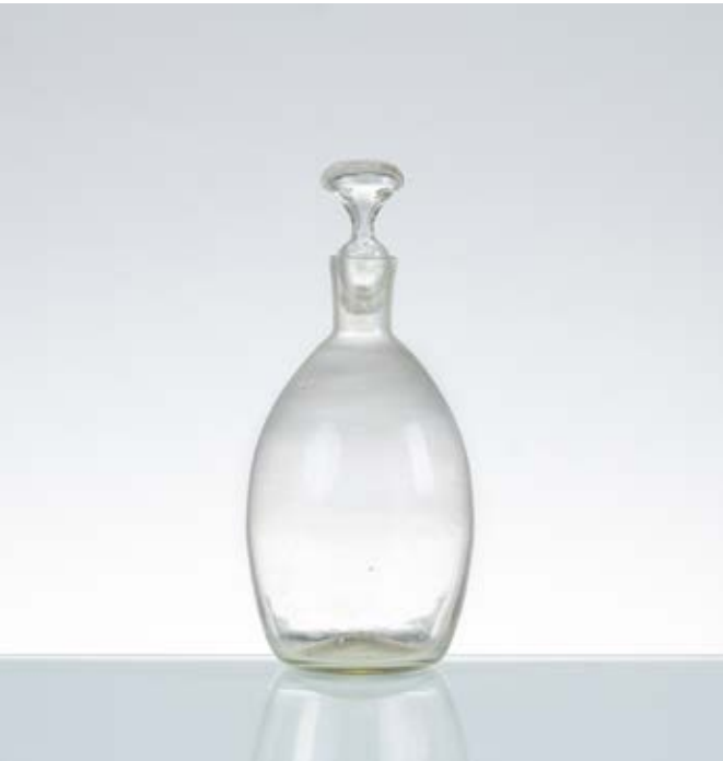
111 CARLO SCARPA Produzione Venini & C, Italia 1936 ca. Bottiglia in vetro soffiato pulegoso, corpo ovalizzato con collo cilindrico, bocca piana circolare, tappo circolare. cm Alt. 24