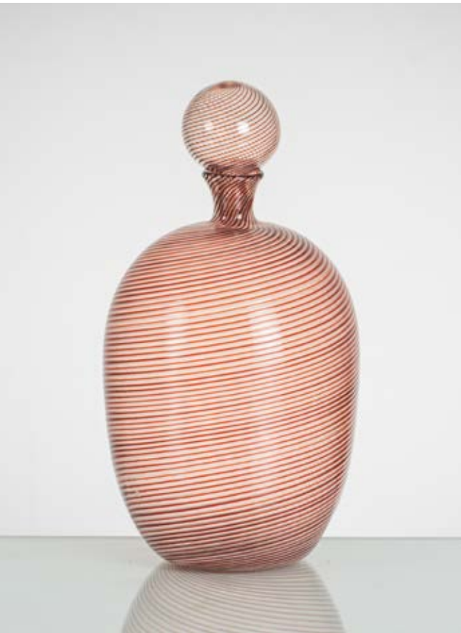
13 VENINI Produzione Murano, Italia 1970 ca. Bottiglia con tappo in vetro soffiato incolore e decorato con mezza filigrana seppia, corpo ad oliva con piccolo e basso collo a vaso, tappo sferico. cm Alt. 26,5 A GLASS BOTTLE BY VENINI. Stima € 300 - 400 Base d’asta € 150