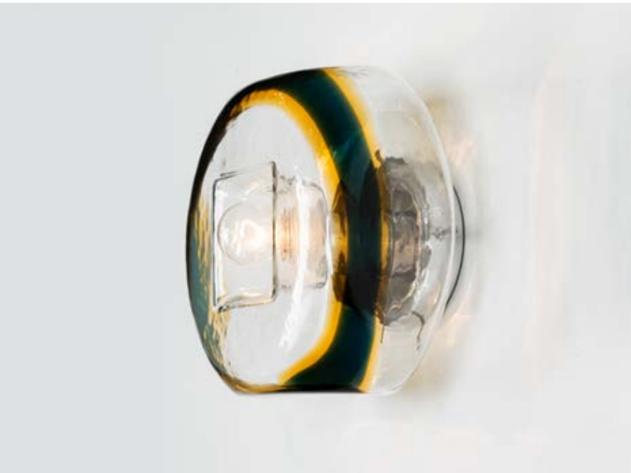
166 A.V. MAZZEGA Produzione Murano, Italia 1970 ca. Lampada da parete ad una luce, struttura in metallo cromato, diffusore sferico in vetro incolore in cavità quadrata decorato con fascia in vetro verde e giallo. Impianto elettrico originale. cm 30 x 30 Alt. 20

Bibliografia: Catalogo altra casa d'aste.