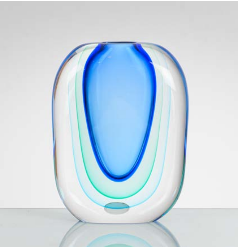
137 LUIGI ONESTO Produzione Murano, Italia 1970 ca. Vaso in vetro sommerso incolore, turchese, verde e blu, corpo ovalizzato con bocca piana circolare. Firma a graffio. cm 18 x Alt. 26

Bibliografia: Catalogo altra casa d'aste.