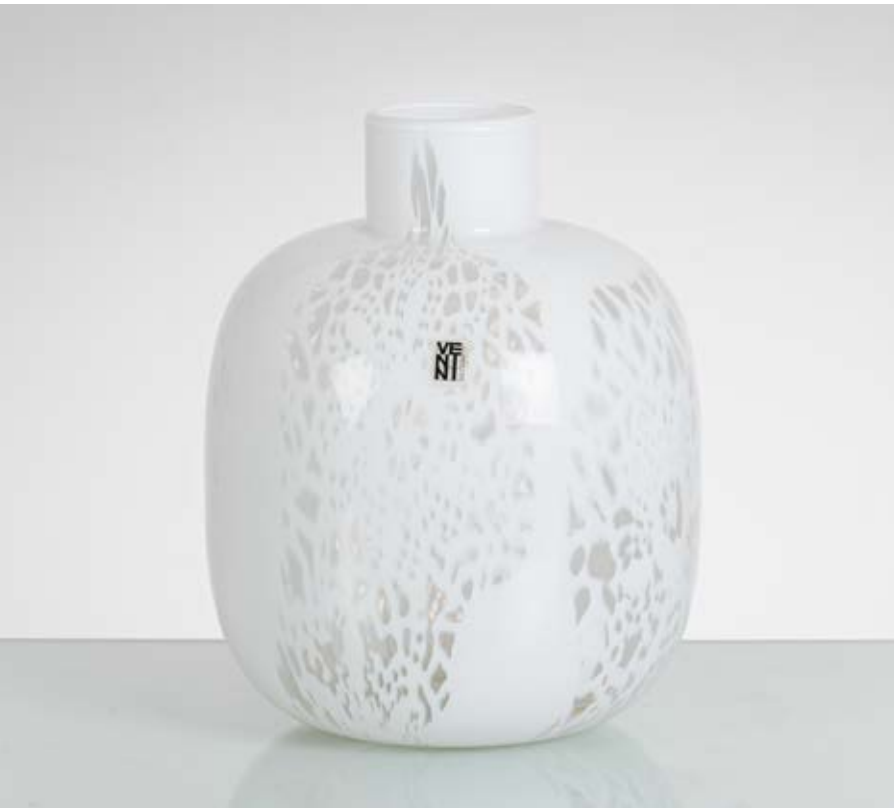
41 OWE THORSSSEN E BRIGITTA KARLSSON Produzione Venini, Italia 1977 ca. Vaso in vetro soffiato della serie “Merletti” con decori in vetro lattimo a disegni astratti traforati, corpo ovalizzato con collo cilindrico e bocca piana. Firma a graffio, data e vecchia etichetta. cm Alt. 25