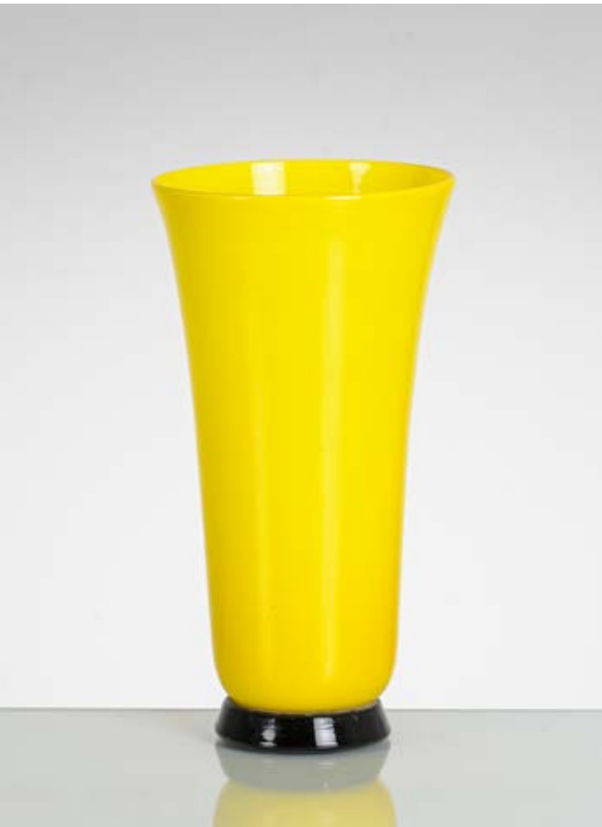
5 VENINI Produzione Murano, Italia 1997 ca. Vaso della serie “Anni Trenta” in vetro soffiato giallo, corpo a tromba, bocca piana circolare, base in vetro nero. Firma a graffio e data. cm Ø 15 Alt. 28