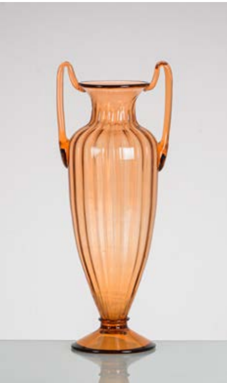
79 VITTORIO ZECCHIN Produzione Cappellin, Italia 1930 ca. Vaso in vetro soffiato trasparente rosato, corpo costolato, collo basso con bocca piana circolare, anse curvate. cm Alt. 48,5

Bibliografia: Catalogo altra casa d'aste.