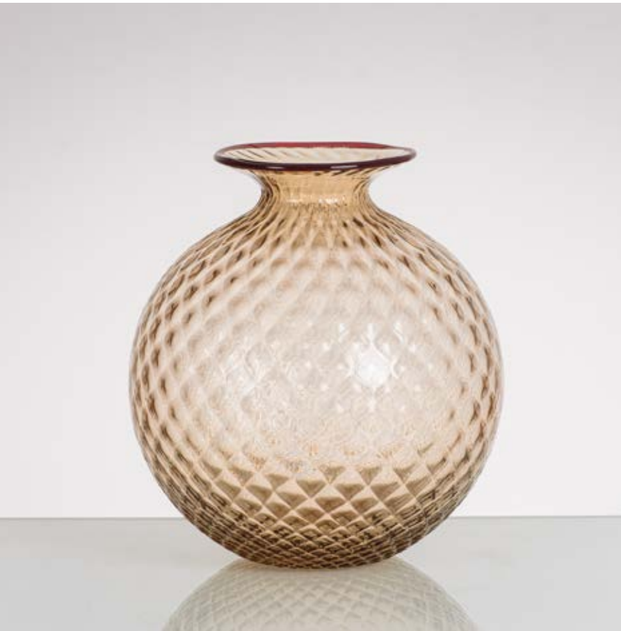
9 VENINI Produzione Murano, Italia 2005 ca. Vaso della serie “Balloton” in vetro soffiato talpa con collo bordato rubino. Firma a punta Venini 2005. cm Alt. 23