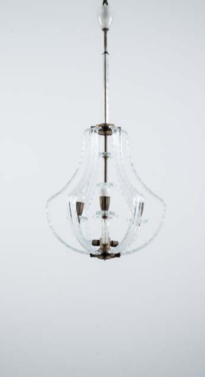
82 SEGUSO VETRI D'ARTE Produzione Murano 1940 ca. Lampada a sospensione a tre luci, struttura in ottone, diffusore in vetro incolore sagomato e molato. cm Alt. 100

A SUSPENSION LAMP BY SEGUSO VETRI D'ARTE.