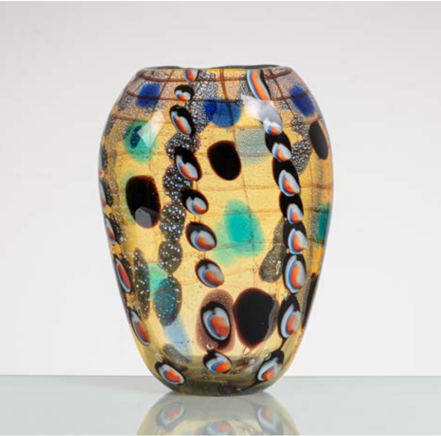
167 FRATELLI TOSO (Attr.le) Produzione Murano, Italia 1970 ca. Vaso in vetro pagliesco sommerso decorato con motivi a macchie policrome, murrine, reticoli, corpo a goccia con bocca circolare lievemente ondulata. cm Alt. 33

A GLASS VASE ATTRIBUTABLE TO FRATELLI TOSO.