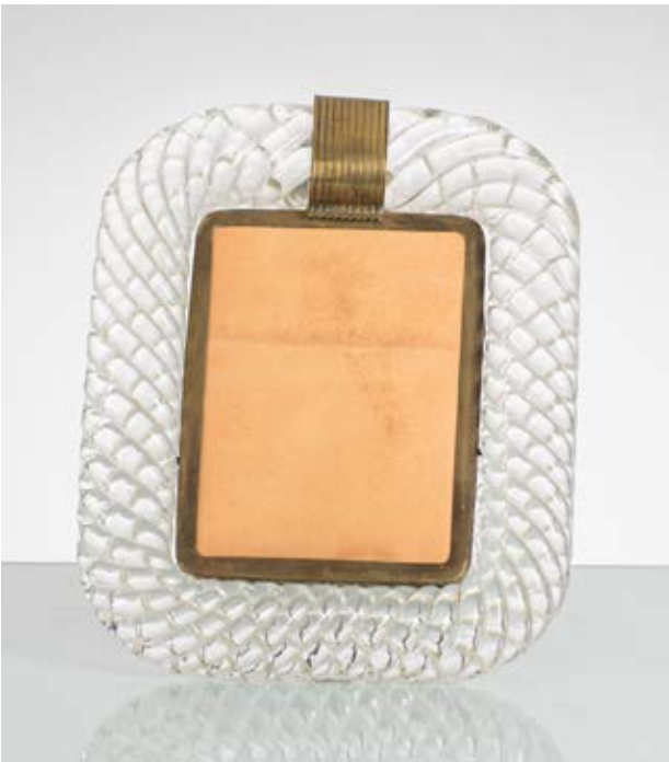
64 VENINI (Attr.le) Produzione Murano, Italia 1940 ca. Cornice portafoto in vetro a torciglione trasparente con montatura e decoro centrale in ottone. cm 28 x 22,5

Bibliografia: Catalogo altra casa d'aste.