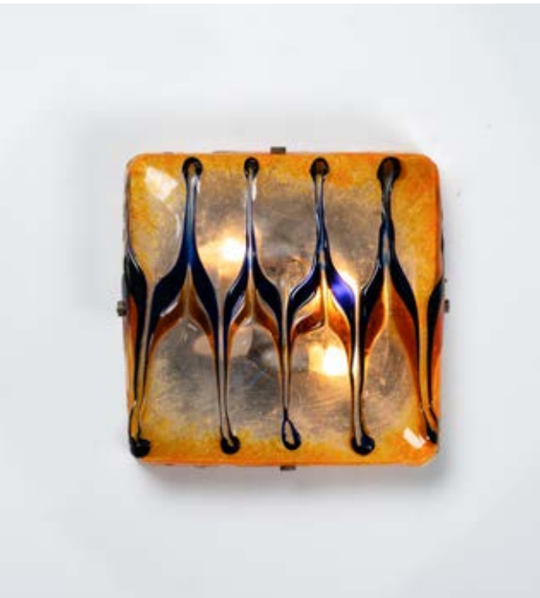
164 TONI ZUCCHERI Produzione Murano 1970 ca. Lampada da soffitto o parete a quattro luci, corpo quadrato in vetro a decoro a fiamme policrome. Struttura in minuterie in metallo. cm 39 x 39 Alt. 10

Bibliografia: Catalogo altra casa d'aste.