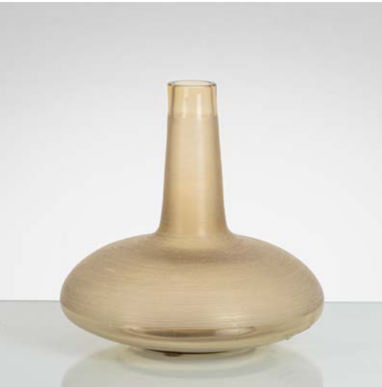
27 ALFREDO BARBINI Produzione Murano, Italia 1980 ca. Vaso in vetro fumè parzialmente trasparente e battuto, corpo a disco con lungo collo e bocca piana circolare. Firma. cm Ø 25,5 Alt. 25,5

Bibliografia: Catalogo altra casa d'aste.