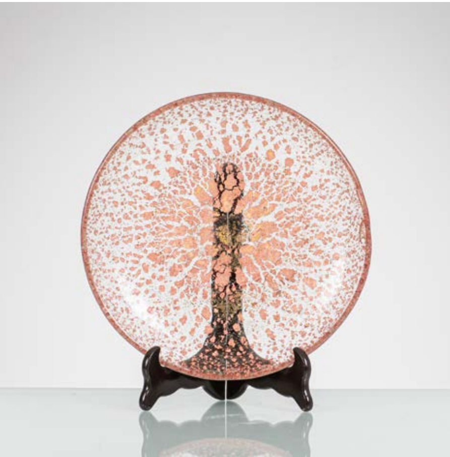
31 BAROVIER E TOSO Produzione Italia 1980 ca. Piatto circolare in vetro incolore con inclusioni rosa ed oro. Firma a graffio “Barovier e Toso”. cm Ø 26,5 A GLASS DISH BY BAROVIER AND TOSO. Stima € 250 - 300 Base d’asta € 100