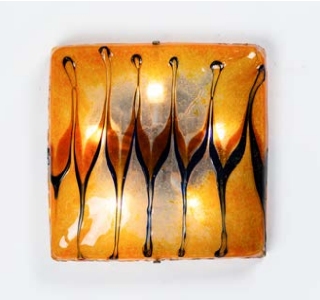
165 TONI ZUCCHERI Produzione Murano 1970 ca. Lampada da soffitto o parete a cinque luci, corpo quadrato in vetro a decoro a fiamme policrome. Struttura in minuterie in metallo. cm 47 x 47 Alt. 10

Bibliografia: Catalogo altra casa d'aste.