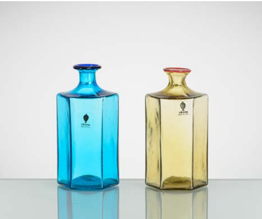
11 VENINI Produzione Murano, Italia 1984 ca. Due bottiglie in vetro soffiato a sezione esagonale, una blu con bocca inchiostro ed una pagliesca con bocca rossa. Etichetta di produzione, firma incisa e data. cm Alt. 12,5