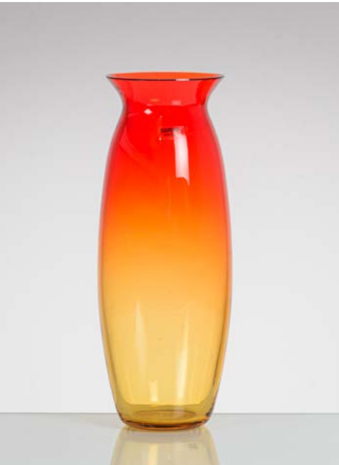
25 ALFREDO BARBINI Produzione Murano, Italia 1990 ca. Vaso in vetro soffiato e decorato a sfumare giallo e rosso, corpo ovalizzato con basso collo e bocca circolare lievemente estroflessa. Firma a graffio ed etichetta. cm Alt. 37