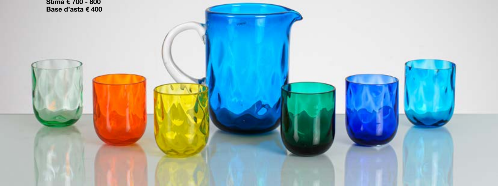
20 SALVIATI Produzione Murano, Italia 1980 ca. Vaso in vetro "Satin" blu, corpo a tromba con bocca piana circolare. Firma a graffio. cm Alt. 54

Bibliografia: Catalogo altra casa d'aste.