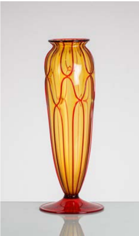
80 VITTORIO ZECCHIN (Attr.le) Produzione M.V.M, Italia 1920 ca. Vaso in vetro soffiato ambra, corpo a goccia con decoro geometrico a filamento rosso, basso collo con bocca circolare lievemente estroflessa, base circolare rossa. cm Alt. 45

A GLASS VASE ATTRIBUTABLE TO VITTORIO ZECCHIN.