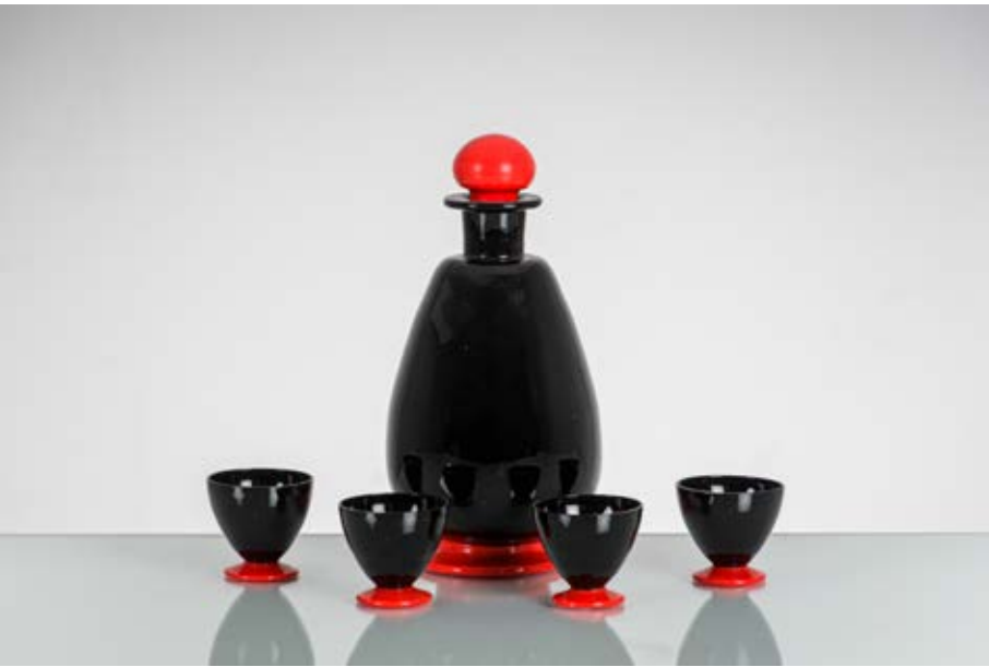
81 NAPOLEONE MARTINUZZI Produzione Italia 1940 ca. Servizio da rosolio composto da quattro bicchieri ed una caraffa in vetro nero e rosso. cm Alt. 4,5 - Alt. 20

Bibliografia: Catalogo altra casa d'aste.