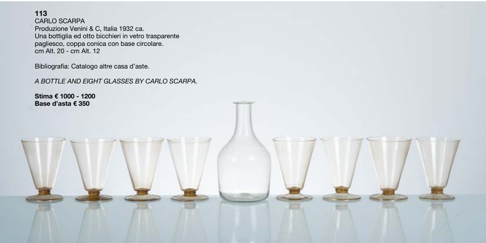
113 CARLO SCARPA Produzione Venini & C, Italia 1932 ca. Una bottiglia ed otto bicchieri in vetro trasparente pagliesco, coppa conica con base circolare. cm Alt. 20 - cm Alt. 12

Bibliografia: Catalogo altre casa d'aste.