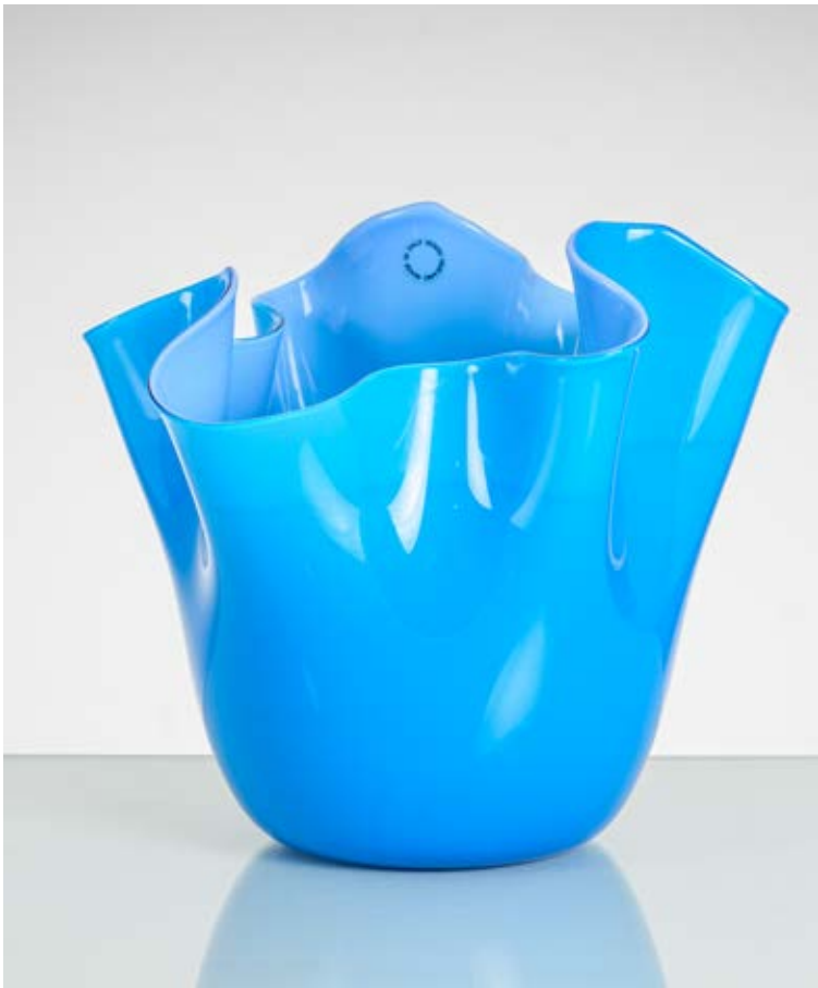
3 FULVIO BIANCONI Produzione Venini, Italia 1997 ca. Vaso modello "Fazzoletto" in vetro opalino Acquamare. Etichetta di produzione, firma e data a graffio. cm 24,5 x 24 Alt. 22