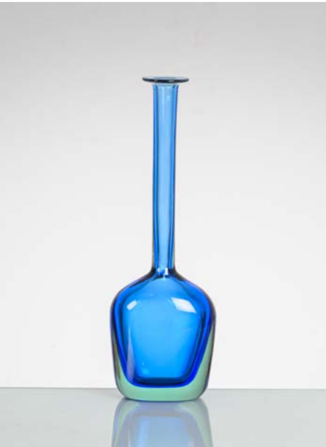
143 FLAVIO POLI Produzione Seguso Vetri d'Arte, Murano, Italia 1960 ca. Bottiglia in vetro sommerso blu e verde, corpo ad oliva, lungo collo cilindrico, bocca piana circolare lievemente estroflessa. cm Alt. 33

Bibliografia: disegno originale catalogo Seguso