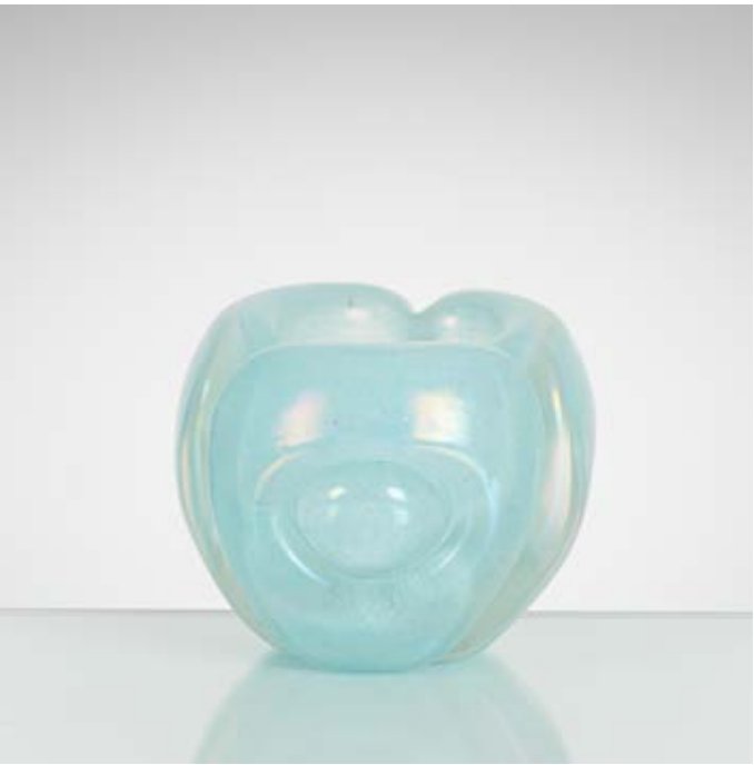
49 ARCHIMEDE SEGUSO (Attr.le) Produzione Murano 1940 ca. Vaso in vetro celestino iridescente, corpo composto da tre petali con decoro circolare. cm 10 x 10 Alt. 8,5

A GLASS VASE ATTRIBUTABLE TO ARCHIMEDE SEGUSO.