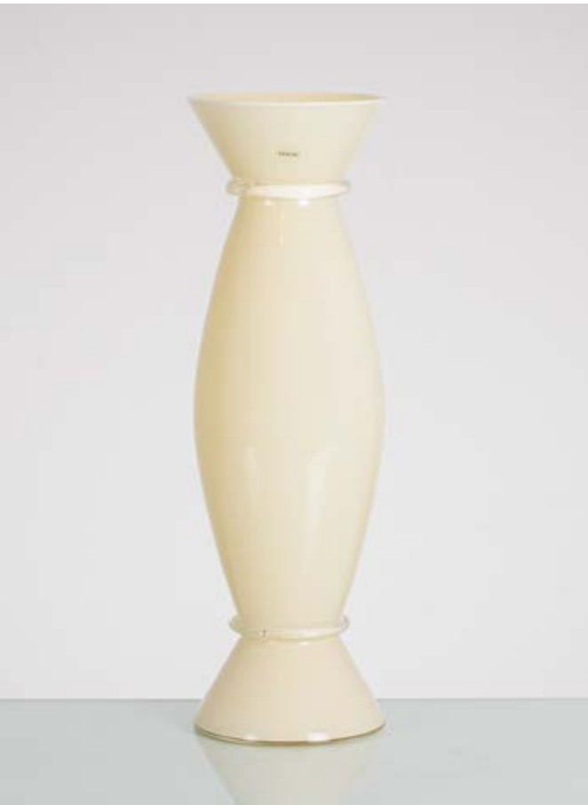
7 ALESSANDRO MENDINI Produzione Venini, Italia 2008 Vaso modello “Acco” in vetro incamiciato lattimo e avorio, corpo a clessidra con collo a vaso e bocca circolare. Etichetta e firma a punta. cm Alt. 44

Bibliografia: Catalogo Venini, Glass objects, p. 37.