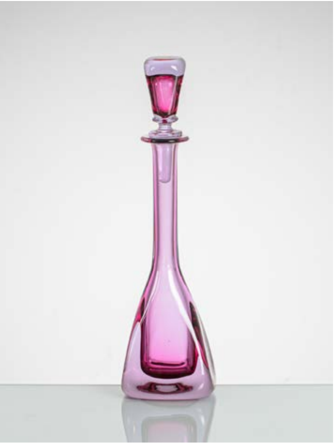
144 FLAVIO POLI Produzione Seguso, Vetri d'Arte, Italia 1960 ca. Vaso in vetro sommerso rosso, lilla, azzurrino, corpo a goccia con stretto collo e piccola bocca circolare piana. cm Alt. 47

Bibliografia: Archivio Seguso disegno vaso simile.