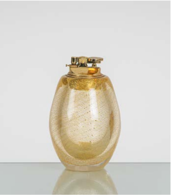
68 TOMMASO BARBI Produzione Seguso, Italia 1970 ca. Accendino da tavolo in vetro trasparente con inclusioni oro, corpo ovalizzato, accensione in metallo dorato. Etichetta di produzione. cm Alt. 14

Bibliografia: Catalogo altra casa d'aste.