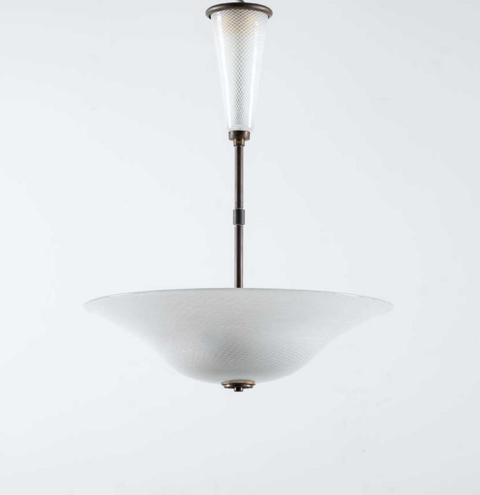
72 TOMASO BUZZI Produzione Venini, Italia 1940 ca. Lampada a sospensione a tre luci variante del modello “5430”, struttura in ottone con diffusore a coppa sagomata in vetro a reticello. cm Alt. 70

Bibliografia: Catalogo Altra casa d’aste.