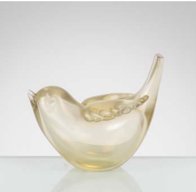
125 TYRA LUNDGREN Produzione Venini 1946 ca. Figura di uccello modello "2627" in vetro paglierino iridescente. Sbeccatura sul becco. cm 10,5 x 7 Alt. 9

Bibliografia: M. Barovier e C. Sonogo, Paolo Venini e la sua fornace, Skira, pag. 349