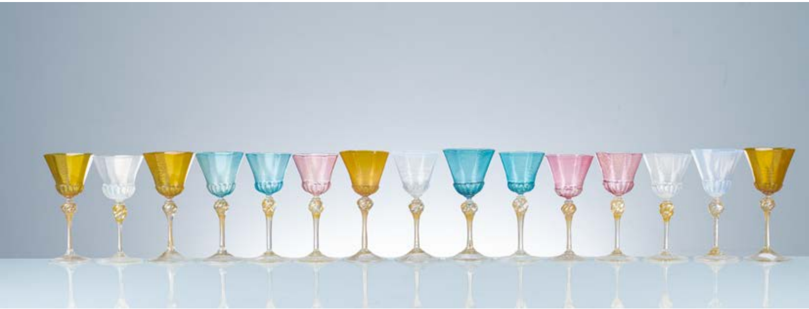
131 SALVIATI Produzione Murano, Italia 1950 ca. Quindici bicchieri a calice di colore differente in vetro soffiato, coppa ottagonale con bocca ondulata e attacco costolato, stelo sottile con sfera cordonata, piede circolare. cm Alt. 17,5 Bibliografia: Catalogo altra casa d'aste. FIFTEEN GLASSES BY SALVIATI.