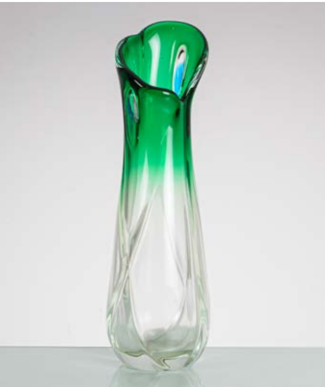
154 MAESTRI MURANESI Produzione Murano 1960 ca. Vaso in vetro a sfumare incolore verde, corpo a goccia con movimento ritorto, bocca asimmetrica diagonale. cm Alt. 49