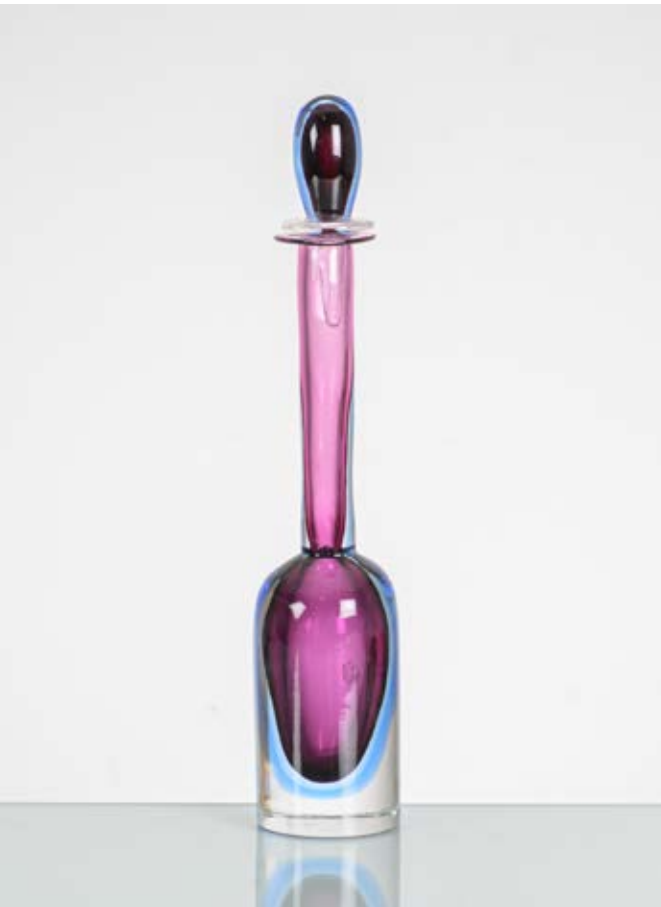
141 FLAVIO POLI Produzione Seguso Vetri d'Arte, Murano, Italia 1960 ca. Bottiglia in vetro sommerso ametista e blu, corpo a cilindro nella parte inferiore, lungo collo tubolare, bocca piana circolare, tappo a goccia. cm Alt. 34

Bibliografia: disegno originale catalogo Seguso.