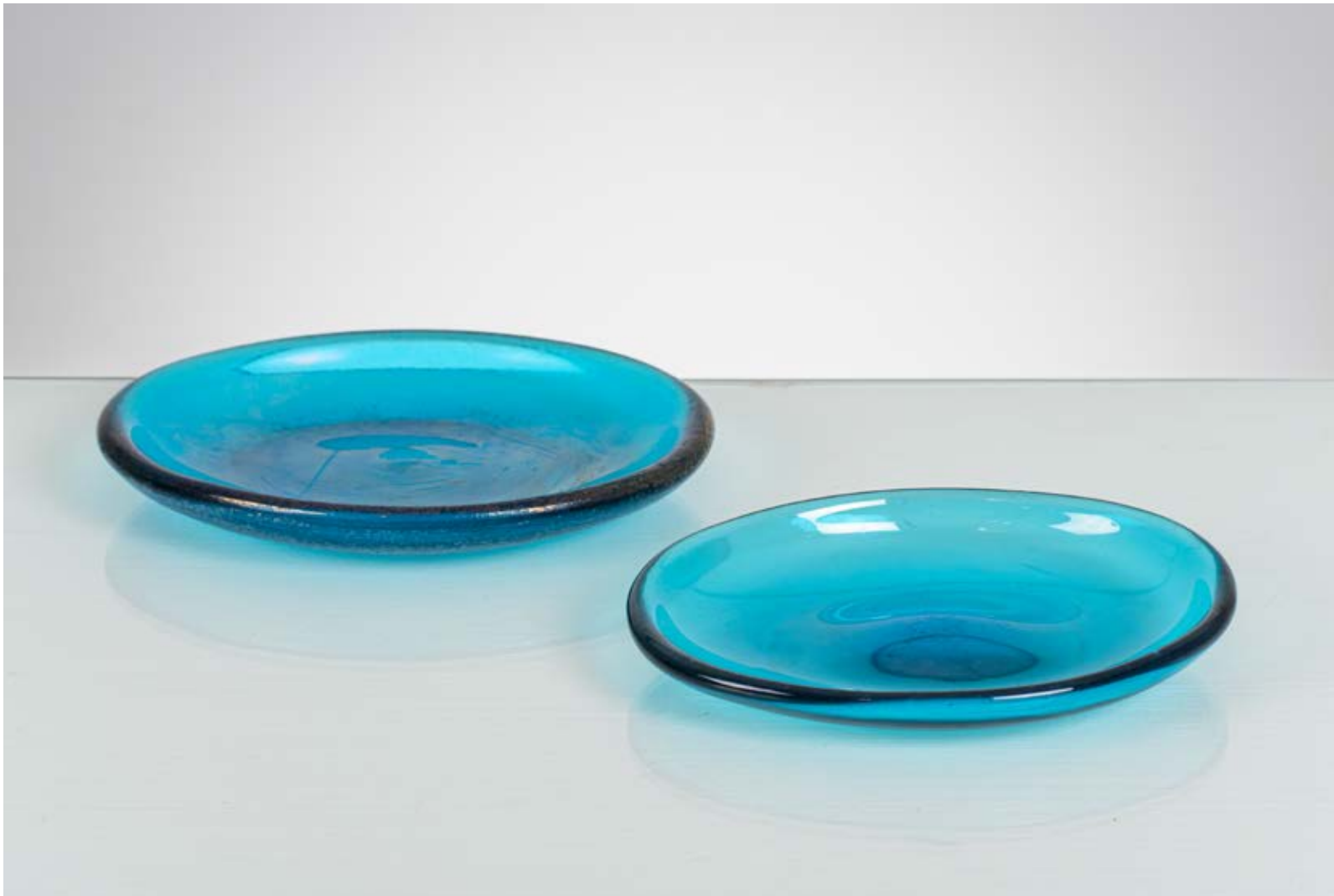
101 CARLO SCARPA Produzione Venini & C, Italia 1936 ca. Due piatti ovali in vetro blu, uno con finitura corrosa, uno iridato. Marchio ad acido "Venini Italia" in un piatto. cm 18 x 14 Alt. 2,6 - 16 x 12,5 Alt. 2,5

Bibliografia: Marino Barovier, Carlo Scarpa, Venini 1932-1947, Skira ed. 2012, pagina 213. (Serie)