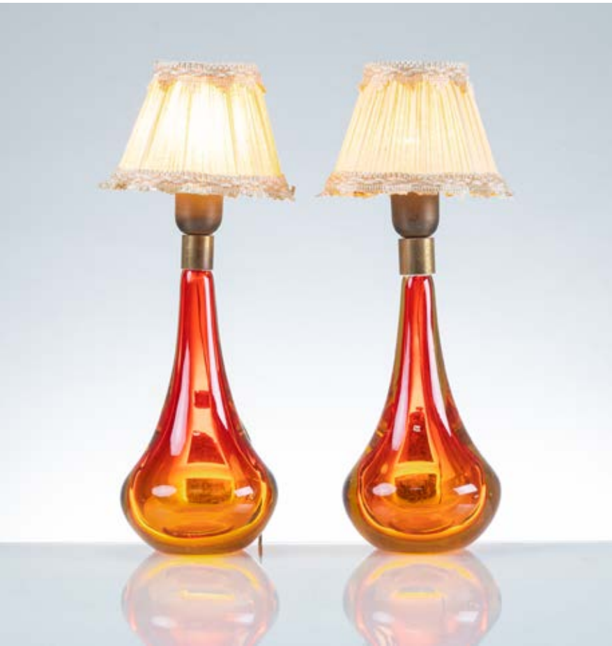
139 FLAVIO POLI Produzione Seguso, Italia 1970 ca. Coppia di lampade da tavolo ad una luce, corpo a goccia in vetro sommerso rosso ed arancione, ottone, diffusori in tessuto avorio. cm Alt. 40