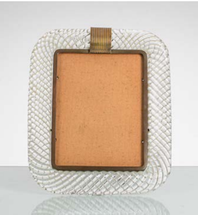
63 VENINI (Attr.le) Produzione Murano, Italia 1940 ca. Cornice portafoto in vetro a torciglione trasparente con montatura e decoro centrale in ottone. cm 32 x 27

Bibliografia: Catalogo altra casa d'aste.