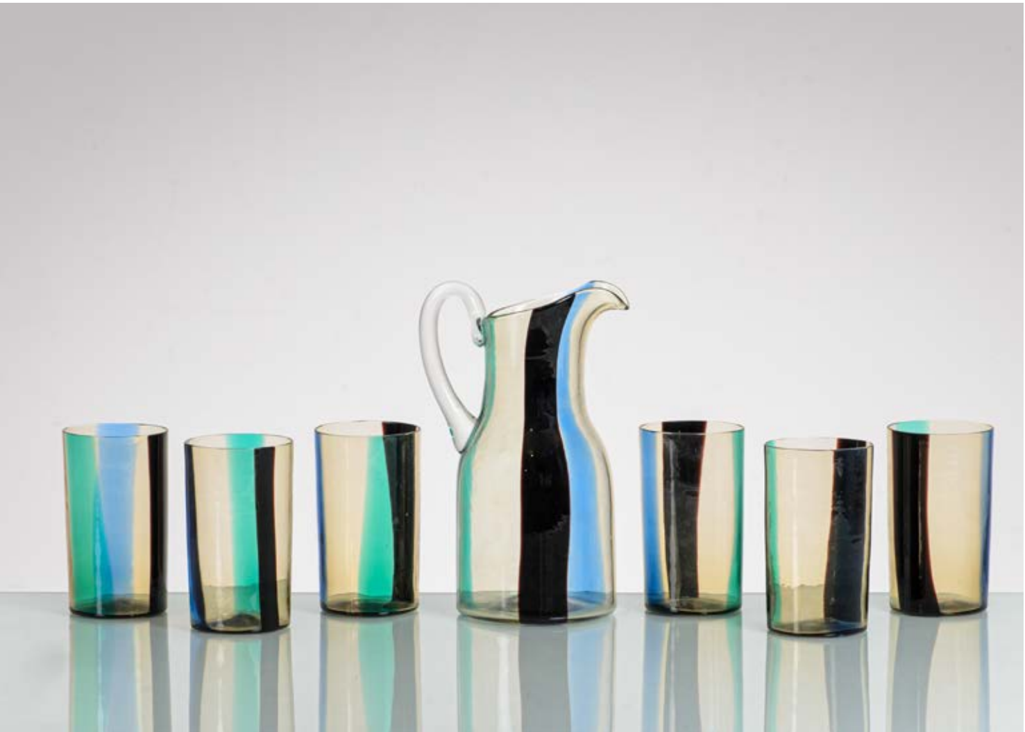
89 FULVIO BIANCONI Produzione Venini, Italia 1950 ca. Caraffa con sei bicchieri in vetro soffiato e decorato con fasce verticali applicate nella combinazione di colori “America”, cristallo, ametista scuro, verde, pagliesco e azzurro. cm Alt. 13,5 - Alt. 23

Bibliografia: Fulvio Bianconi alla Venini, a cura di M. Barovier e C. Sonogo, Skira, Milano 2015, pp. 197, 207.