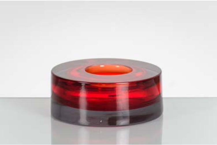
156 SEGUSO VETRI D'ARTE Produzione Murano, Italia 1960 ca. Porta candela in vetro sommerso rosso, corpo circolare con bocca piana. cm Ø 15 Alt. 6 Bibliografia: Catalogo altra casa d'aste. A GLASS CANDLEHOLDER BY SEGUSO VETRI D'ARTE. Stima € 150 - 180 Base d'asta € 60