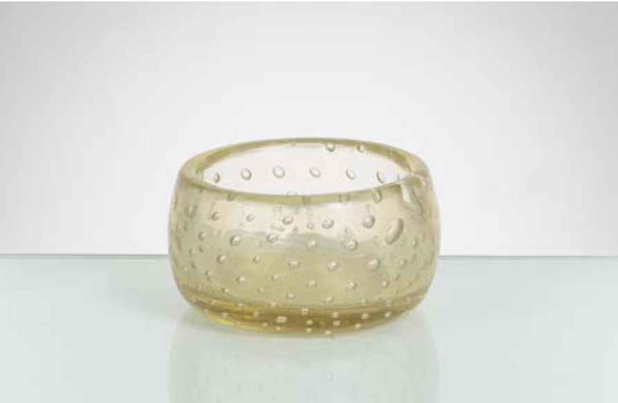
97 CARLO SCARPA Produzione Venini & C, Italia 1935 ca. Coppa circolare in cristallo iridato e bolle regolari. cm Ø 10 Alt. 5,5

Bibliografia: Catalogo altra casa d'aste.