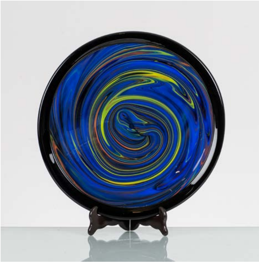
28 OTTAVIO MISSONI Produzione Arte Vetro, Italia 1980 ca. Piatto circolare con decoro marmorizzato policromo, bordo in vetro nero. cm Ø 38

Bibliografia: Catalogo altra casa d'aste.