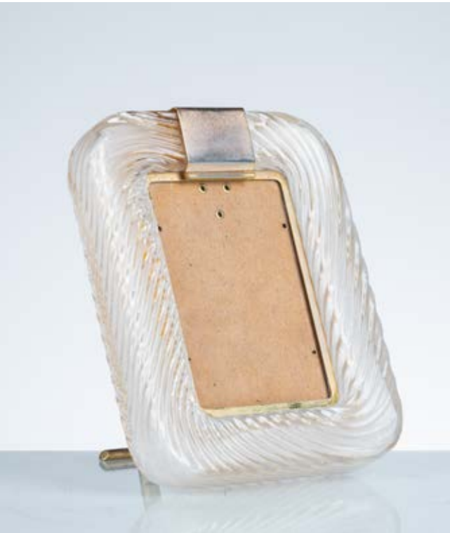
65 VENINI (Attr.le) Produzione Murano, Italia 1940 ca. Cornice portafoto in vetro a torciglione trasparente con montatura e decoro centrale in ottone. cm 27 x 22

Bibliografia: Catalogo altra casa d'aste.