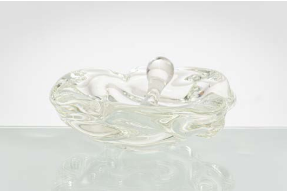
43 ARCHIMEDE SEGUSO Produzione Seguso Vetri d'Arte, Italia 1940 ca. Posacenere con pestello in vetro sommerso incolore, corpo circolare decorato con rilievi informi. cm Ø 20 Alt. 6,5 - Alt. 10 Bibliografia: Catalogo altra casa d'aste. A GLASS ASHTRAY AND PESTLE BY ARCHIMEDE SEGUSO. Stima € 250 - 300 Base d'asta € 100