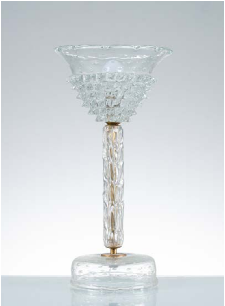
48 ERCOLE BAROVIER Produzione Barovier, Italia 1940 ca. Lampada da tavolo ad una luce, struttura in ottone e vetro incolore, diffusore a campana in vetro parzialmente rostrato e bullicante, base circolare bullicante. cm Alt. 49

Bibliografia: Catalogo altra casa d'aste.