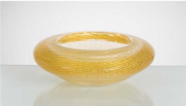
66 TOMMASO BARBI Produzione Seguso, Italia 1970 ca. Ciotola in vetro trasparente con inclusioni oro, corpo circolare con larga bocca piana. Etichetta di produzione. cm Ø 23,5 Alt. 8

Bibliografia: Catalogo altra casa d'aste