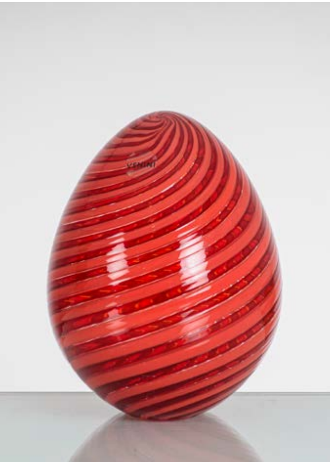
1 VENINI Produzione Murano, Italia 2004 ca. Uovo a canne colorate rosse trasparenti e ritorte. Firma e data a graffio. cm Alt. 14