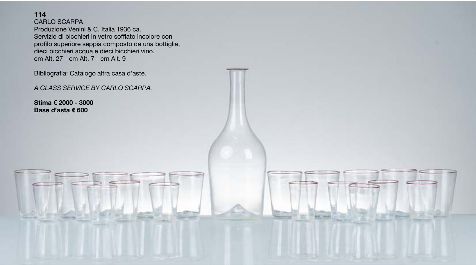
114 CARLO SCARPA Produzione Venini & C, Italia 1936 ca. Servizio di bicchieri in vetro soffiato incolore con profilo superiore seppia composto da una bottiglia, dieci bicchieri acqua e dieci bicchieri vino. cm Alt. 27 - cm Alt. 7 - cm Alt. 9

Bibliografia: Catalogo altra casa d'aste.