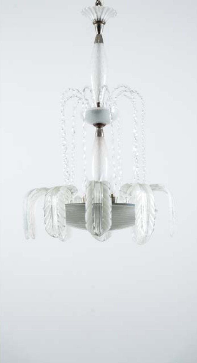
83 ERCOLE BAROVIER Produzione Barovier 1940 ca. Lampada a sospensione a sette luci, struttura in metallo e vetro incolore, corpo a fontana, diffusore a disco in vetro pulegoso e decorato a spirale con foglie ricadenti in vetro incolore e satinato, su un piano superiore zampilli in vetro incolore tortile. cm Alt. 95

Bibliografia: Catalogo altra casa d'aste.