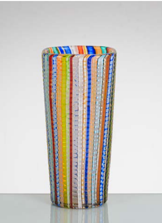
17 CENEDESE Produzione Murano, Italia 1980 ca. Vaso a canne colorate e battute, corpo cilindrico con bocca piana circolare. Firma. cm Alt. 27

Bibliografia: Catalogo altra casa d'aste.