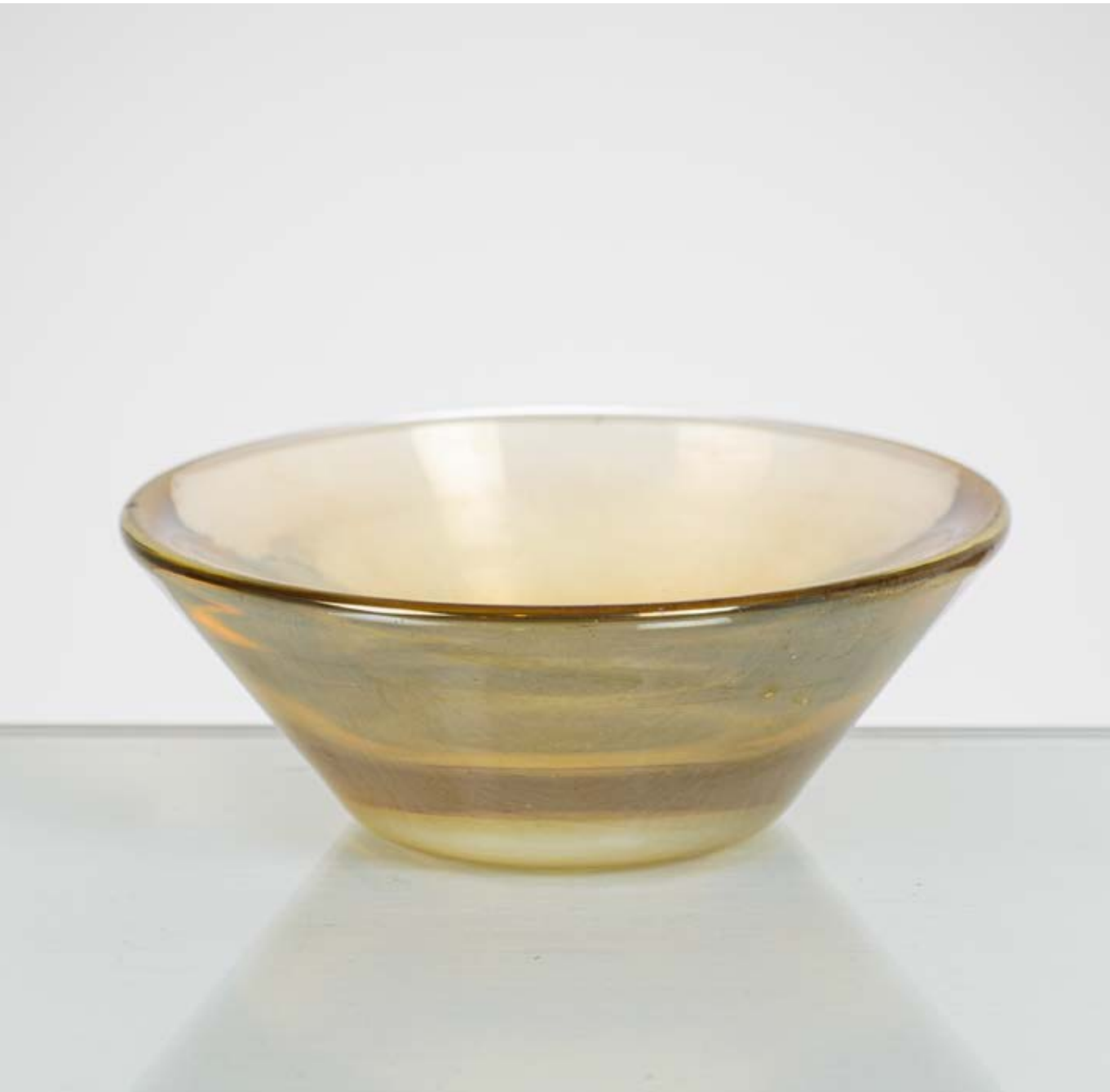
100 CARLO SCARPA Produzione Venini & C, Italia 1930 ca. Coppa in vetro iridato pagliesco, corpo tronco conico, bocca piana circolare. cm Ø 12,5 Alt. 4,5