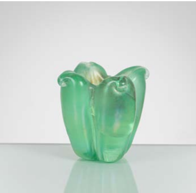
124 ARCHIMEDE SEGUSO Produzione Seguso Vetri d'Arte, Italia 1936 ca. Vaso in vetro verde nord iridato, corpo composto da quattro costole con punta ricurva. Difetti. cm 7 x Alt. 8,5

Bibliografia: R. Barovier Mentasti, A. Berengo, The Secret of Murano, Venezia 1997, p. 48. (Serie)