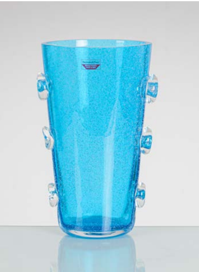
19 ERCOLE BAROVIER Barovier & Toso, Murano 1960 ca. Vaso "Spuma di mare" in vetro azzurrino con decoro di anelli incolore ai lati, corpo a cono con bocca piana. Etichetta e marca incisa "Barovier e Toso Murano". cm Alt. 31

Bibliografia: Catalogo altra casa d'aste.