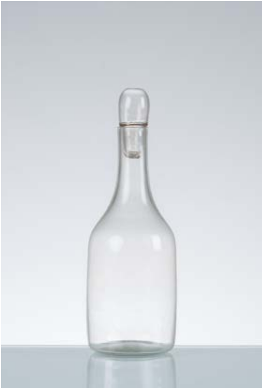
112 CARLO SCARPA Produzione Venini & C, Italia 1938 ca. Bottiglia in vetro soffiato incolore, corpo e collo con cilindrico, bocca piana circolare, tappo ovalizzato. cm Alt. 30