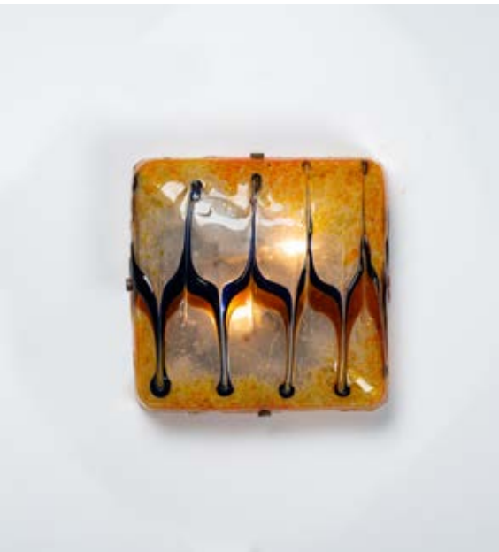
163 TONI ZUCCHERI Produzione Murano 1970 ca. Lampada da soffitto o parete a due luci, corpo quadrato in vetro a decoro a fiamme policrome. Struttura in minuterie in metallo. cm 30 x 30 Alt. 7

Bibliografia: Catalogo altra casa d'aste