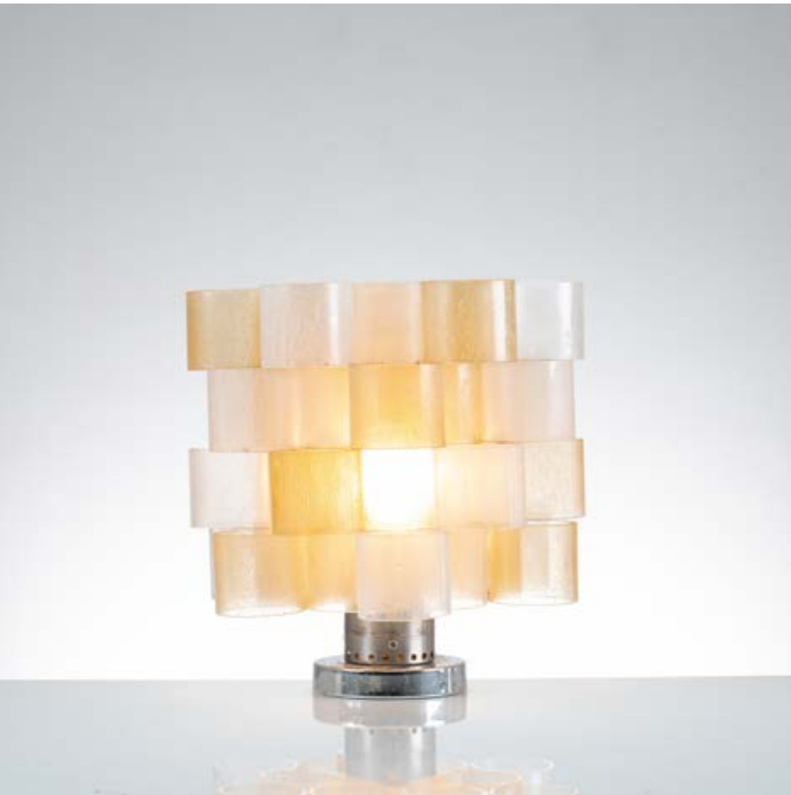
159 ALBANO POLI Produzione Poliarte, Italia 1970 ca. Lampada da tavolo ad una luce modello “Globula”, struttura in metallo cromato, diffusore composto da anelli cilindrici sovrapposti in vetro bullicante incolore e pagliesco. cm Alt. 36

Bibliografia: Catalogo altra casa d’aste.