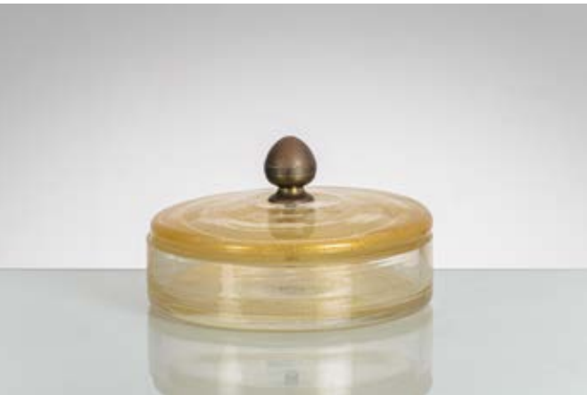
67 TOMMASO BARBI Produzione Seguso, Italia 1970 ca. Scatola con coperchio in vetro trasparente con inclusioni oro, corpo circolare, presa a pigna in ottone. Etichetta di produzione. cm Ø 20 Alt. 5

Bibliografia: Catalogo altra casa d'aste.