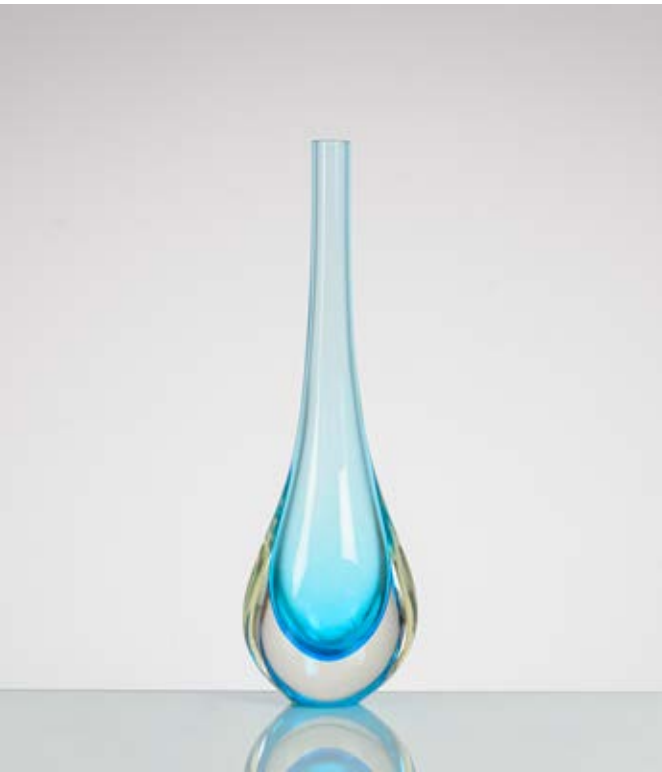
155 LA MURRINA Produzione Italia 1980 ca. Vaso in vetro sommerso, blu, turchese e incolore, corpo a goccia, collo alto e stretto, bocca circolare piana. Firma a graffio. cm Alt. 43