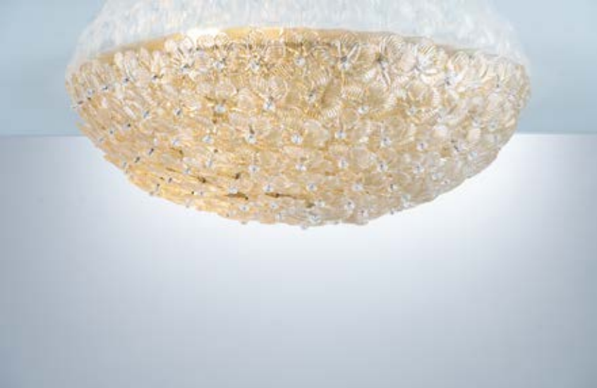
161 SEGUSO Produzione Italia 1960 ca. Grande lampada da soffitto a tre luci, struttura emisferica in metallo verniciato ricoperta da piccoli fiori in vetro di murano incolore con inclusioni oro. cm Ø 52 Alt. 16

Bibliografia: Catalogo altra casa d’aste.