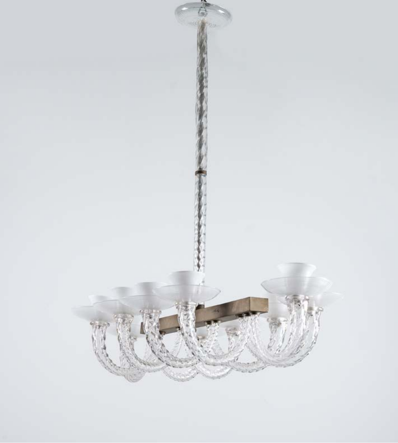
73 VENINI Produzione Murano, Italia 1940 ca. Lampada a sospensione a dieci luci, struttura in ottone, corpo a gondola, diffusori con bracci in vetro incolore cordonato, coppe a campana in vetro lattimo e piatti in vetro a lavorazione a spirale. cm 122 x 53 Alt. 114