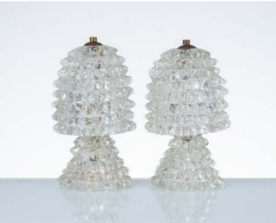
47 ERCOLE BAROVIER Produzione Barovier e Toso, Italia 1940 ca. Coppia di lampade da tavolo ad una luce in vetro incolore rostrato, base conica con diffusore a campana, minuterie in ottone. Lievi difetti. cm Alt. 20

Bibliografia: Catalogo altra casa d'aste.