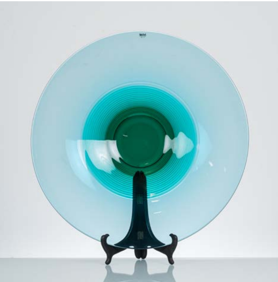
23 VEART Produzione Murano 1990 ca. Piatto in vetro azzurrino soffiato e molato, parte centrale verde smeraldo. Etichetta adesiva Veart e firma incisa a graffio. cm Ø 49 Alt. 6

Bibliografia: Catalogo altra casa d'aste.