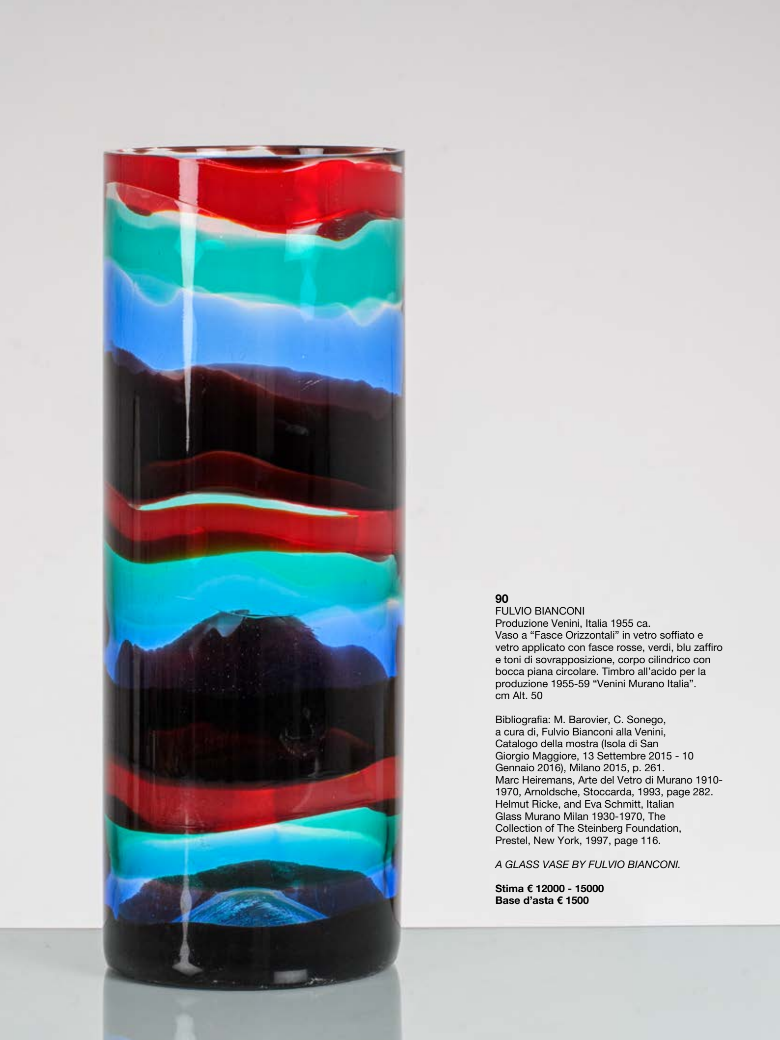
90 FULVIO BIANCONI Produzione Venini, Italia 1955 ca. Vaso a “Fasce Orizzontali” in vetro soffiato e vetro applicato con fasce rosse, verdi, blu zaffiro e toni di sovrapposizione, corpo cilindrico con bocca piana circolare. Timbro all’acido per la produzione 1955-59 “Venini Murano Italia”. cm Alt. 50