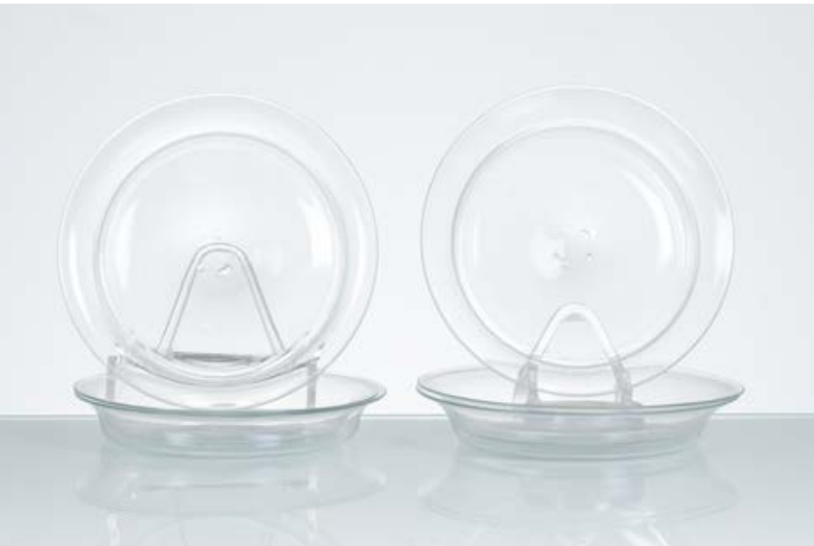
110 CARLO SCARPA Produzione Venini & C, Italia 1935 ca. Sei piatti circolari in vetro soffiato incolore, trasparente e lievemente iridato. cm Ø 17 Alt. 2,5